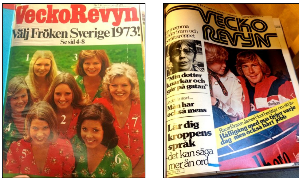
Bild 3 och 4. Till vänster: omslag Veckorevyn 1973/14. Till höger: omslag Veckorevyn 1977/15.

Under period 2 har nummer 14 från 1973 och nummer 15 från 1977 analyserats. 1977 fanns inget modereportage.