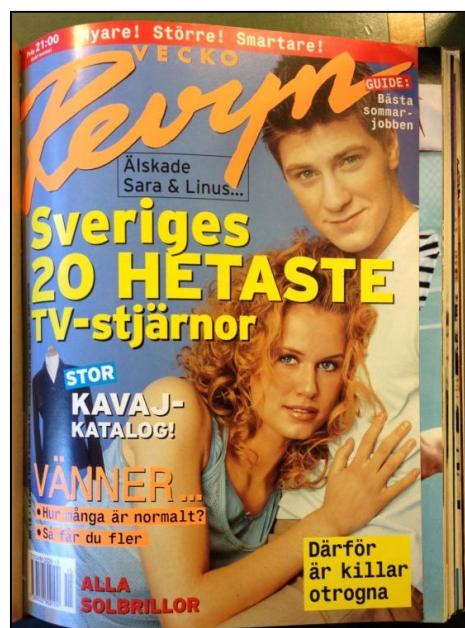
Bild 5 och 6. Till vänster: omslag Veckorevyn 1993/14. Till höger: omslag Veckorevyn 1997/15.