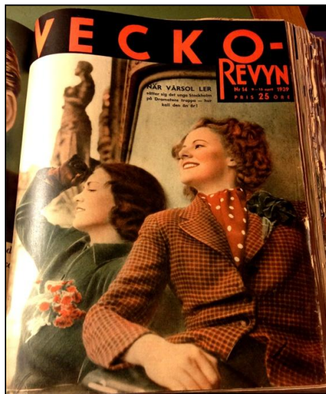
Bild 1 och 2. Till vänster: omslag Veckorevyn 1936/26. Till höger: omslag Veckorevyn 1939/14.