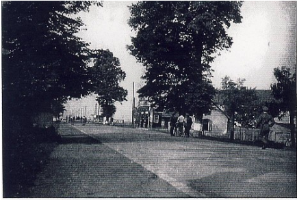
Tajně pořízený snímek pertruce osob v Kbelích u Prahy. Nikdo nemohl opustit město, byly uzavřeny všechny komunikace z Prahy a zastavena železniční doprava. V noci z 27. na 28. května následovala první velká razie - „dům od domu“.