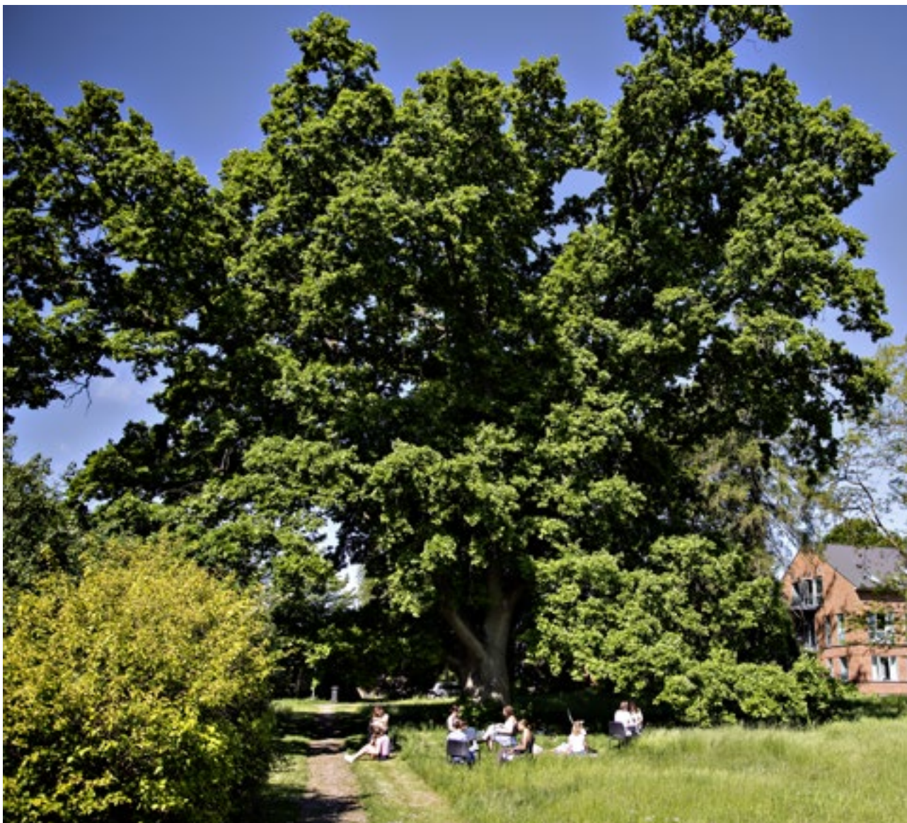
Begtrups egetræ, juni 2020