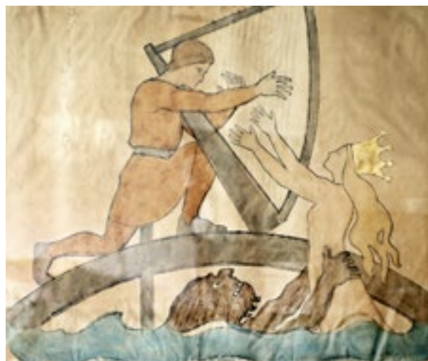
Niels Skovgaards tegning til smeden, der fremstillede højskolens vejrføj.