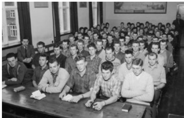
Fra vinterskolen 1961-62

Vi forventer at programmets råskitse vil se ud som på næste side, men der kan ske ændringer i rækkefølge mm. når programmet bliver detailplanlagt og i henhold til de til den tid gældende retningslinier for forsamlings.