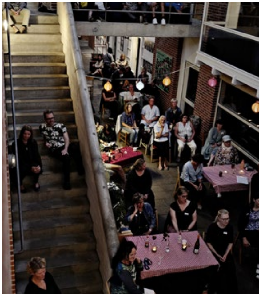
Sommerkursus. Rytmisk kor