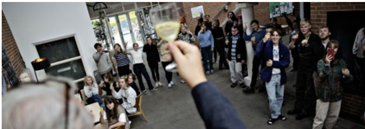
Fra jubilæumsdagen 16. okt. 2020