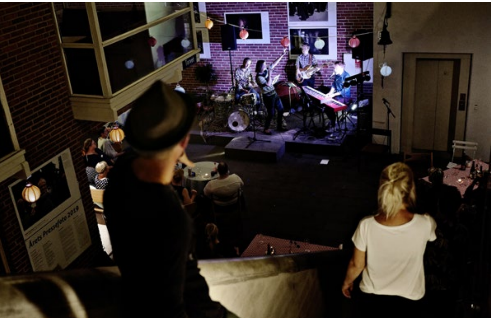
Sommerkursus Rytmisk kor, juli 2020