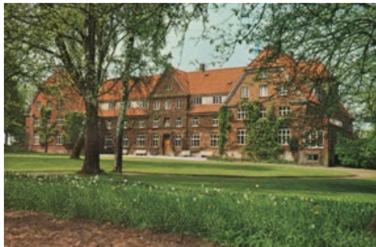
Frederiksborg Højskoles hovedbygning, der i 1987 blev erstattet af nybyggeri.