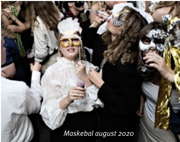
Maskebal august 2020