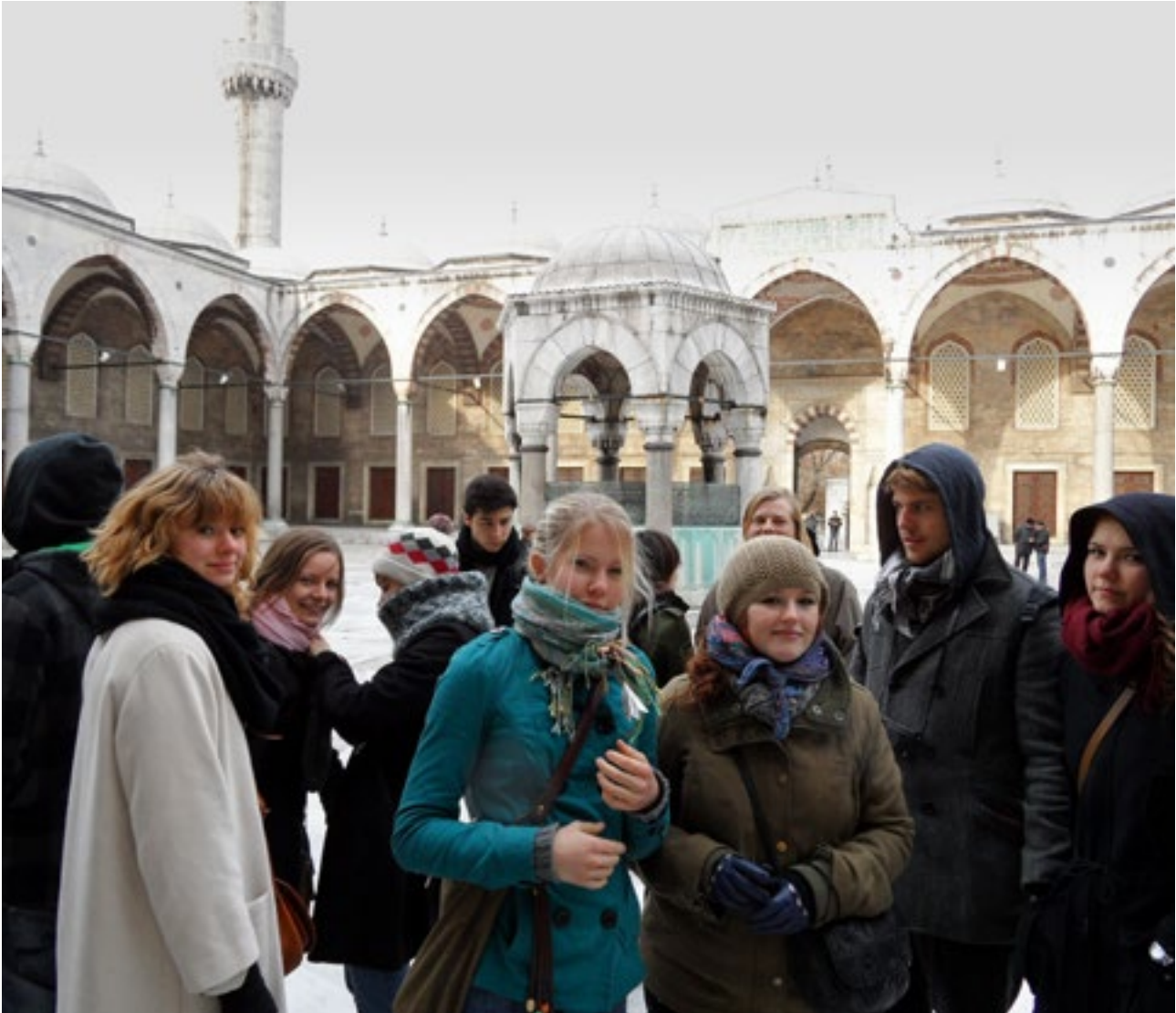
Efterårsholdet 2010 var på fælles studietur til Istanbul i december.