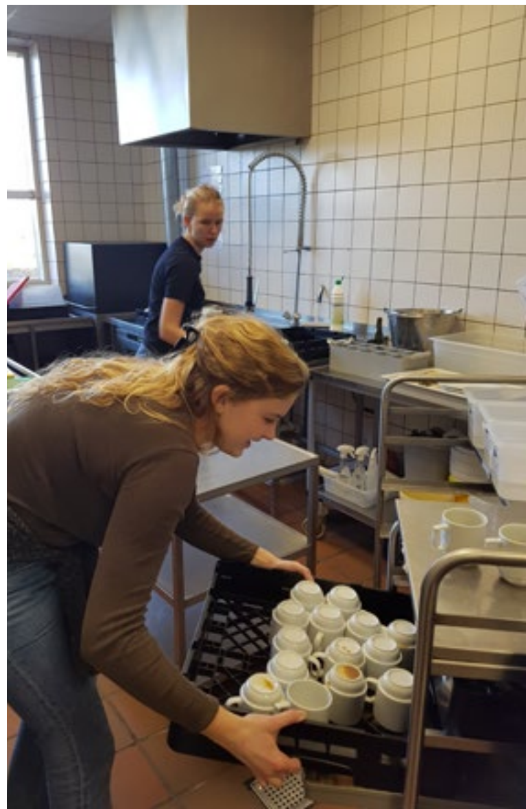
Fra efteråret 2019