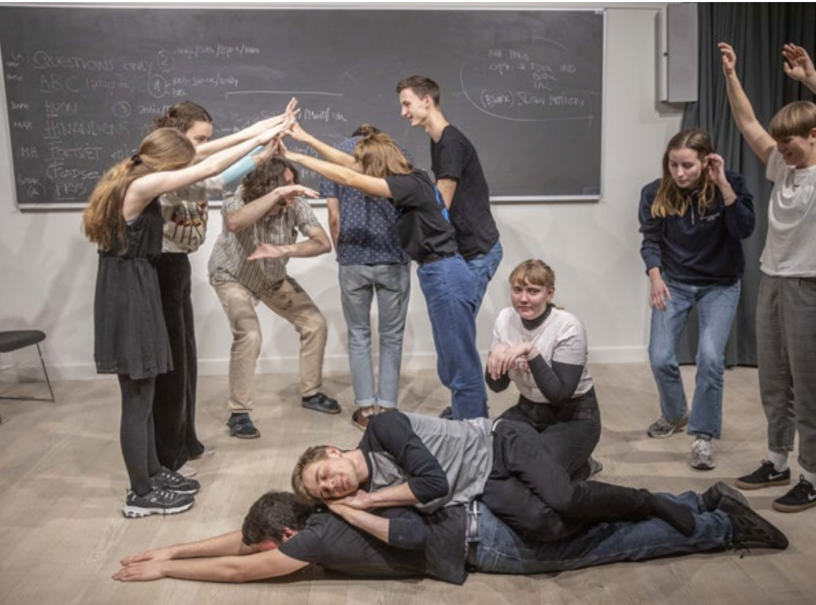
Fra februar 2020.