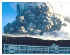
火砕流、火砕サージ(2000年 三宅島)

火山灰や岩塊、火山ガスや水蒸気などが一体となって急速に山体を流下する現象です。時速数十kmから数百kmで流れることが多く、温度は数百度にも達します。