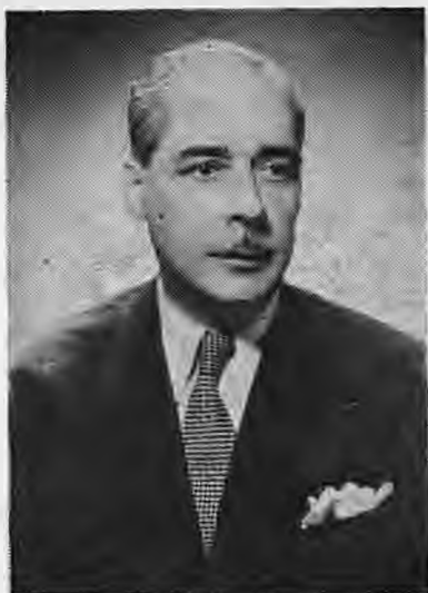
Ο Δήμαρχος Φιλώτας Κόκκινος

αυτούς τους δρόμους. Άλλοι δρόμοι ήταν οι Βύρωνος, Νοσοκομείου, από Δημαρχίας στα Γαλάκεια και από κεί στ' Αλώνια. Επίσης άνοιξε τις σημερινές πλατείες Καρατάσιου και Δημαρχίας.