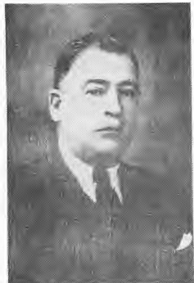
Ο Δήμαρχος Γεώργιος Περδικάρης (Τζιών)