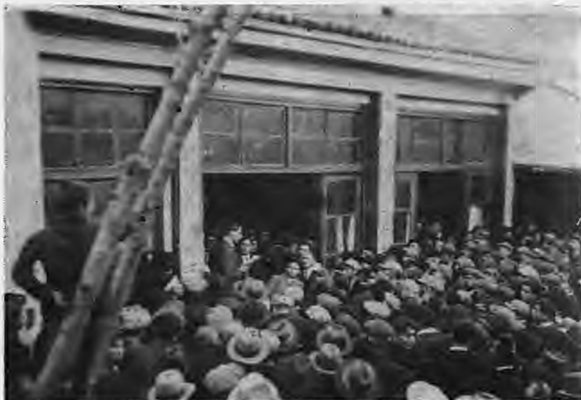
Ομιλία του Φιλώτα στην Ομόνοια 1932

— Τον Φιλώτα απομακρύνει η δικτατορία του Μεταξά και καθήκοντα δημάρχου ανατίθενται στο Σταύρο Κούλη. Έτσι φθάνει η Νάουσα στον πόλεμο του 1940. Σε μια εποχή που το ΕΠΟΣ καταλαγιάζει αντιθέσεις και ο λαός ενωμένος ρίχνεται στον αγώνα για τη διαφύλαξη των ιερών της πατρίδας.