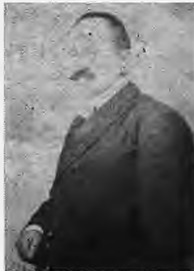
Ο Δήμαρχος Γρηγόριος Περδικάρης

Από το 1916 ως το 1918 διορίζεται δήμαρχος από το παλάτι: μετά από παρέμβαση του Δραγούμη, ο γυναικαδελφός του Χατζημαλούση, Γρηγόριος Περδικάρης, ο οποίος καταδίδει τον Χ' Μαλούση και τον φυλακίζει. Αυτόν διαδέχεται ο διορισμένος Σπ. Λαναράς.