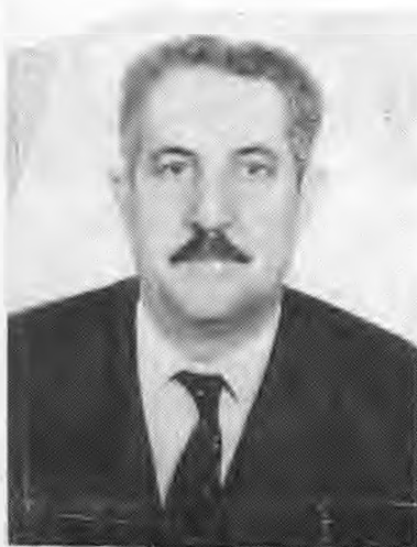
Ο Δήμαρχος Αλέκος Χωνός