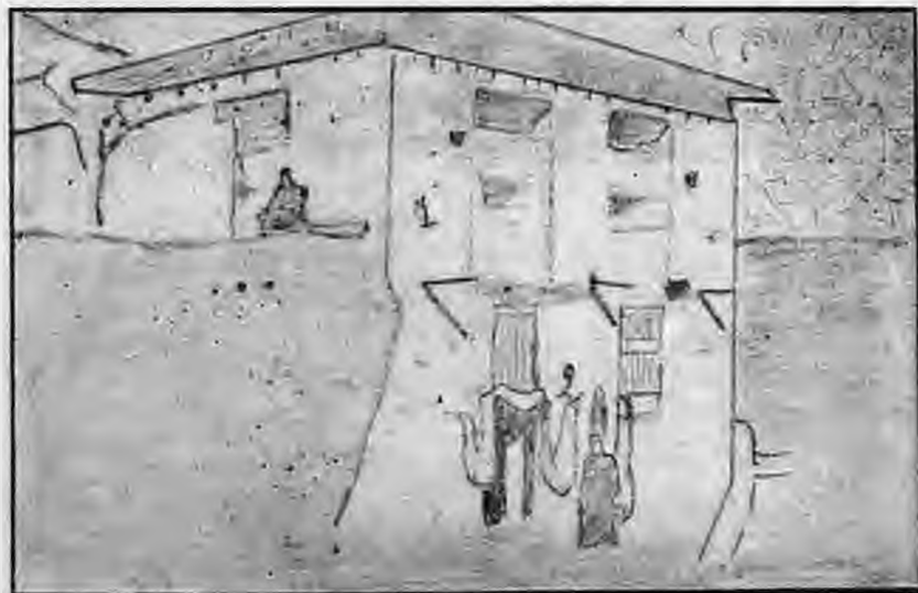
Φουτουγγ. 2. Μπανάνι 1. Σιαϊάκι 2.