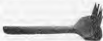
Φουτογρ. 3. Λανάρι παλιουκιριακιου μη νγιό σειρές δόντγια μακριά.

πριν απ' τα χίλια ινιακόσια τάφκιαναν σιδηράδοι. Σι μνιά χουντρή λαμαρίνα πιρτσιμόουναν νγιό σειρές δόντγια πυκνά ένα ικατοστό τόνα απ' τ' άλλου. Τα δόντγια είχαν μάκρους 12-15 πόντους κι πάχους στη βάση 2 χιλιοστά κατάληγαν σι μύτη φιλή. Η λαμαρίνα μη τα δόντγια καρφόνουνταν σι ξύλου σαν χέρι, μη απαλάμι 15-20 πόντους μάκρους, 12 πόντους φάρδους κι 2-2,5 πόντους πάχους. Του χειρούλι έφτανιεν τους 40-50 πόντους κι ήταν στράγγυλου πιληκητό (φουτ. 3). Μ' ένα τέτχιου ανάπουδα λαναρίζουν.