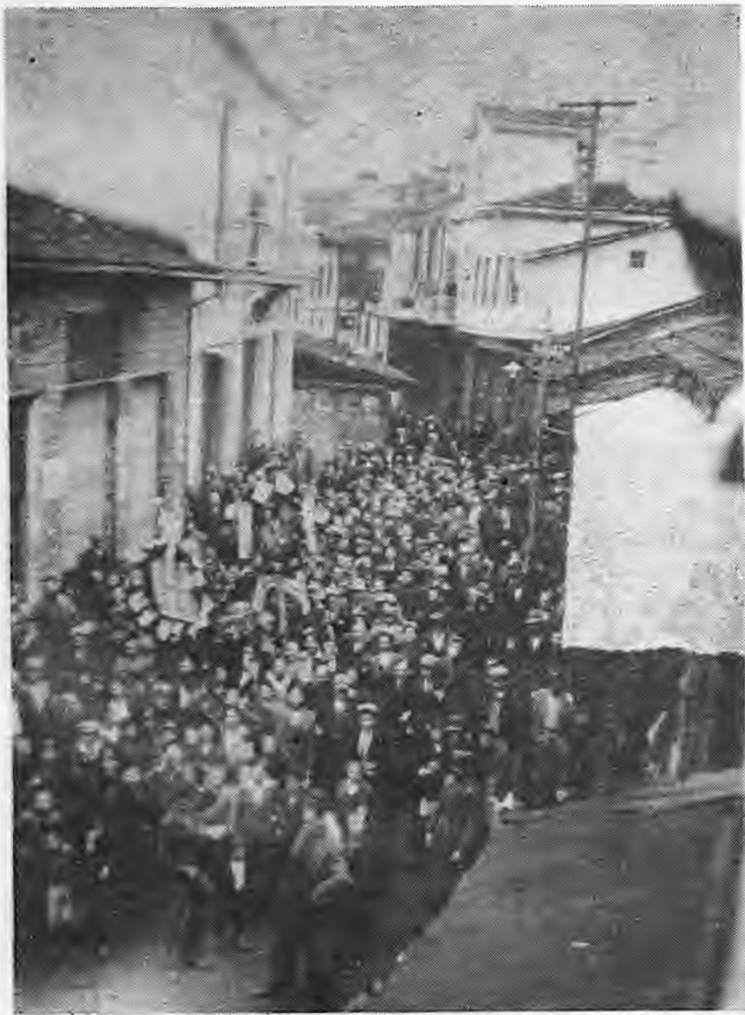
Ομιλία Τζιών Περδικάρη

ως τα σήμερα. Το υδραγωγείο γίνε- ται πλέον με μεταλλικές σωλήνες και δρύσιες τοποθετούνται μέσα σε κάθε σπίτι, χωρίς να επιδαρυνθούν οι δημότες. Για πρώτη φορά χα- ράσσεται το σχέδιο πόλεως, χωρίς να παρεμβάδινουν οι πλούσιοι, αλλά από ειδικό επιστήμονα. Ζητά την οριστική και τελική επίλυση του λάσπυρ Σελίου. Κατασκευάζονται μερικοί αναγκαϊότατοι αγροτικοί δρόμοι. Και για πρώτη φορά μετά τον Ν' Κωνσταντίνο Μαλούση τον οποίο έχει δοηθή και σύμβουλό του φαρμακογεί τα εργοστάσια που κι- νούνται με νερό του Δήμου. Επίσης κατασκευάζει την ηλεκτρική εται- ρεία και ηλεκτροδοτεί τα σπίτια. Το 1929 χτίζει τα Δημοτικά Σφαγεία, τότε που άλλες πόλεις έσφαζαν ζων- τανά στους σταύλους. Τα ίδια λει- τούργουν ως τα σήμερα. Έρχεται σε σύγκρουση με τους Λαναράδες τους οποίους και θέλει να φορολο- γήσει για να ελαφρύνει τους φτω- χούς. Αυτό στέκεται αιτία να κα- τεβάσουν οι δεύτεροι το προσωπικό τους σε απεργία το 1932 και μετά