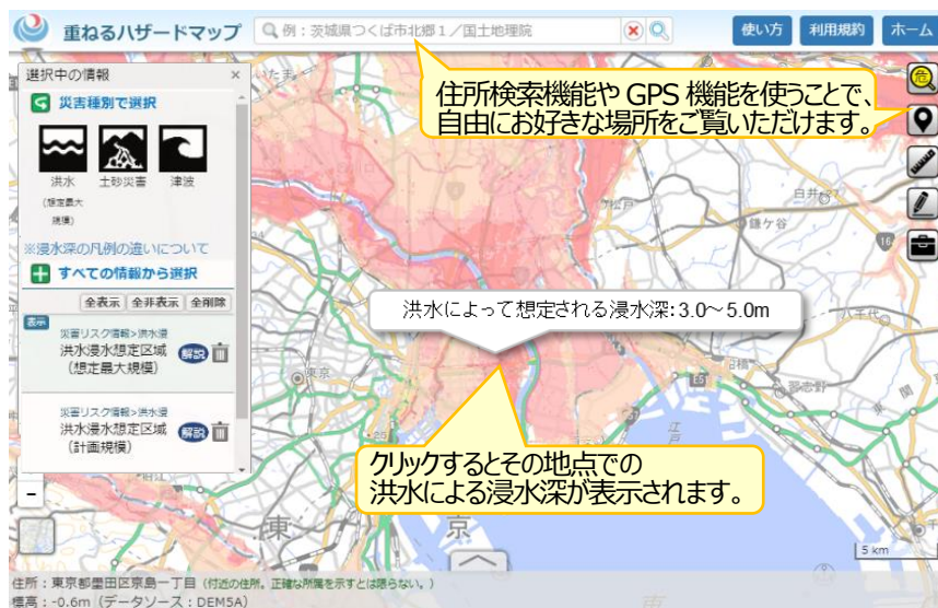
「重ねるハザードマップ」での洪水浸水想定区域(想定最大規模)の表示