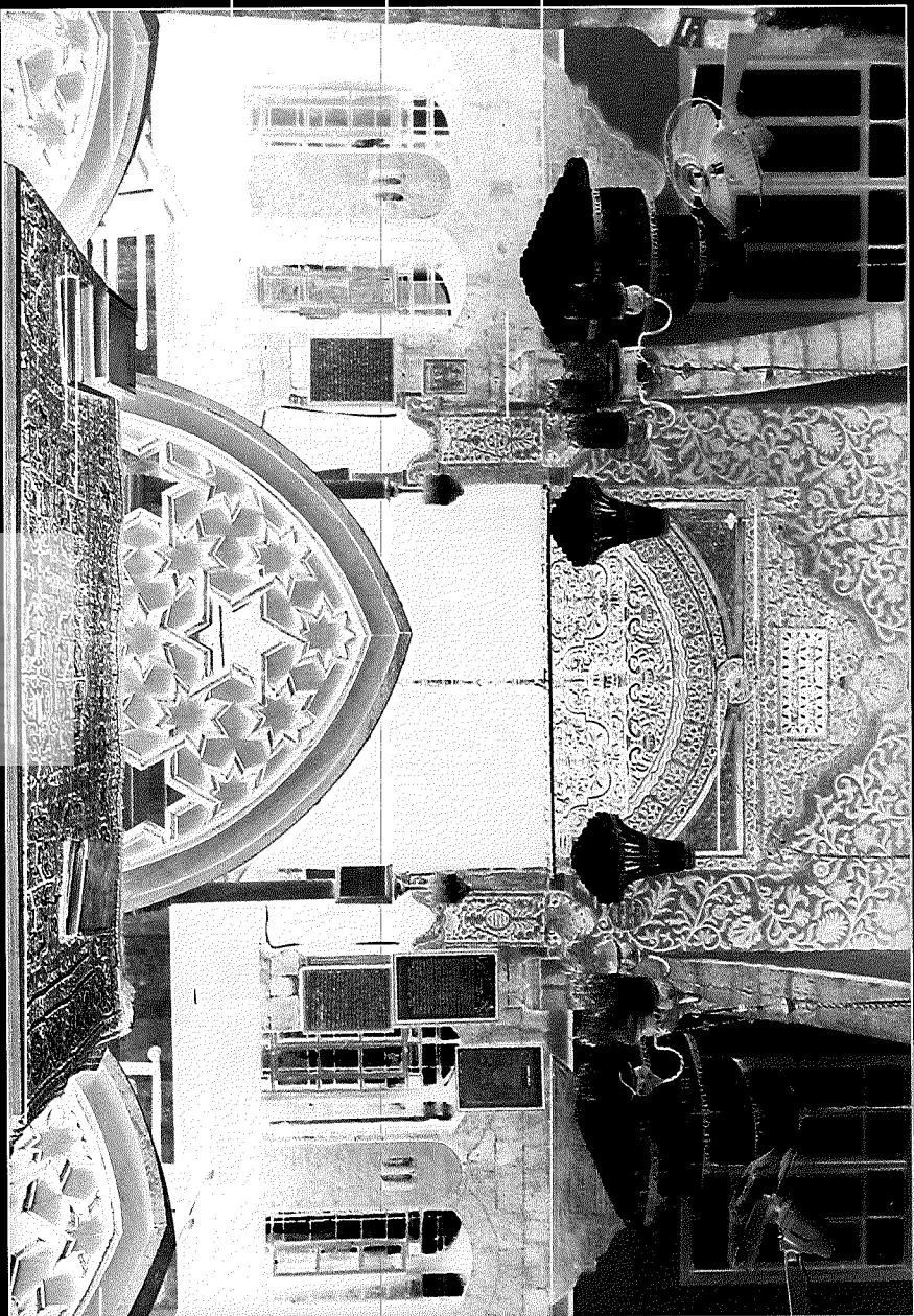
בית הכנסת יאזפריני, דמשק, 1994