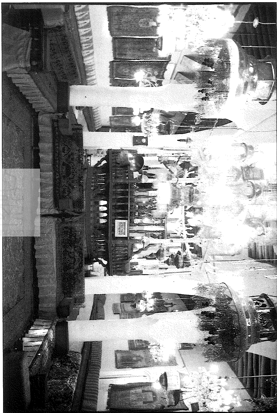
בית החינות בני ברק, 1994