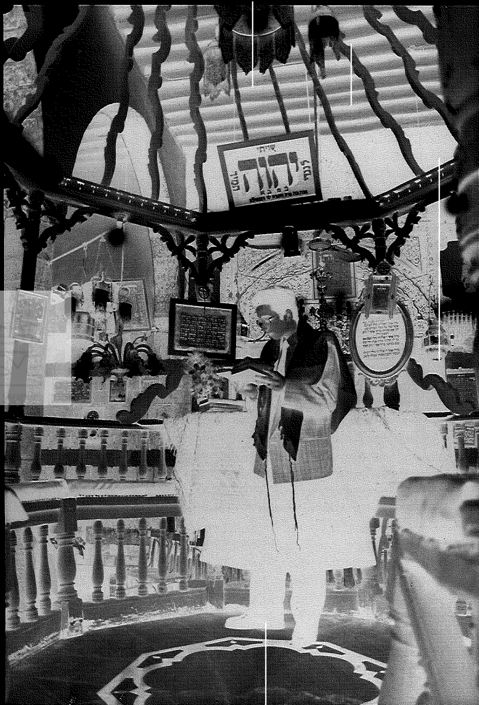
תפילה בבית־הכנסת ירקוי, דמשק, פסח תשנ"ה