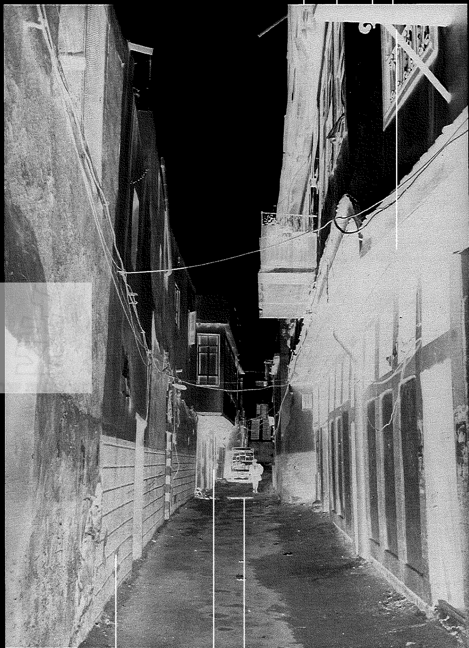
הרובע היהודי, דמשק 1995