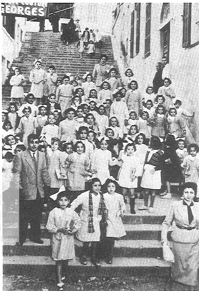
תלמידות בית ספר כ"ח לבנות בראשית שנות החמישים של המאה העשרים.

ראינו אפוא את הסיבה המיידית לארגון הקהילה ותיארנו את מהלך העניינים בעקבות זאת. מהפכת "התורכים הצעירים" הפיחה בפעילים מקומיים התלהבות ויוזמה והם החלו בפעולות הארגון. אולם, השפעתה של המהפכה על החיים היהודיים לא חלה רק בבירות, אלא גם במקומות נוספים ברחבי האימפריה, כגון סלוניקי, 103 דמשק 104