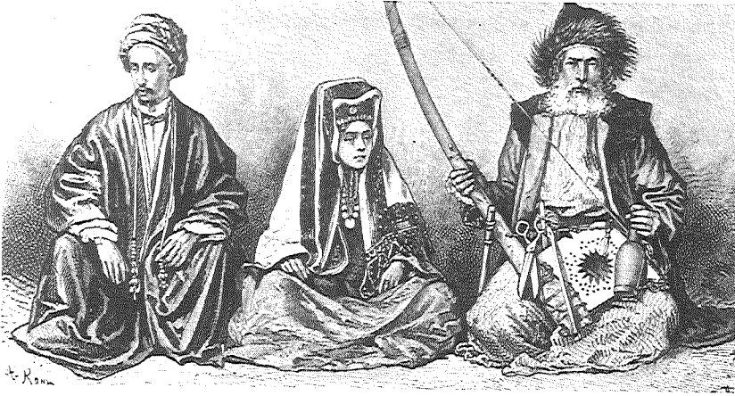
יהודים מבירות, 1880. המקור:

A. Rubens, A History of Jewish Costume , London and Jerusalem 1973