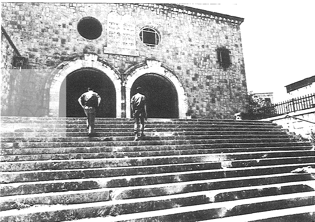
חזית בית הכנסת בבחמדון, 1982.