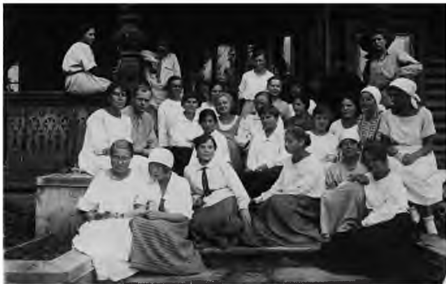
Сотрудники и практикантки (Голицынские курсы) на Московской областной опытной станции, отдел садоводства, Мысово, 1919 г.

официально закон не допускал женщин в университеты, de facto почти все (кроме Варшавского) начали принимать женщин на правах вольнослушательниц; в 1908 г. их насчитывалось 1690 [14]. Снять ограничения в праве женщин получать высшее образование требовали и депутаты недавно созданной Государственной думы [20]. Изменилась ситуация и с частными учебными заведениями. В декабре 1905 г. вышел указ о разрешении открывать женские курсы с программой обучения объемом выше среднего учебного заведения и со статусом «частных» [3. С. 100]. Это позволило сделать Стебутовские курсы высшими, а также открыть в 1908 г. в Москве Голицынские высшие женские сельскохозяйственные курсы. Курсы организовали преподаватели МСХИ во главе с Д.Н. Прянишниковым, который их возглавил [21]; они существовали на общественные средства (взносы слушательниц, помощь ОСЖСХО и частные пожертвования – в первую очередь княгини С.К. Голицыной, предоставившей помещение созданной ею женской гимназии). Значительно менее притягательными для женщин оказались объединенные Петербургские сельскохозяйственные курсы, созданные в 1906 г. группой приват-доцентов университета. В 1914 г. там среди 1448 слушателей было только 111 женщин [14. С. 144]. В 1913 г. Саратовское общество сельского хозяйства открыло