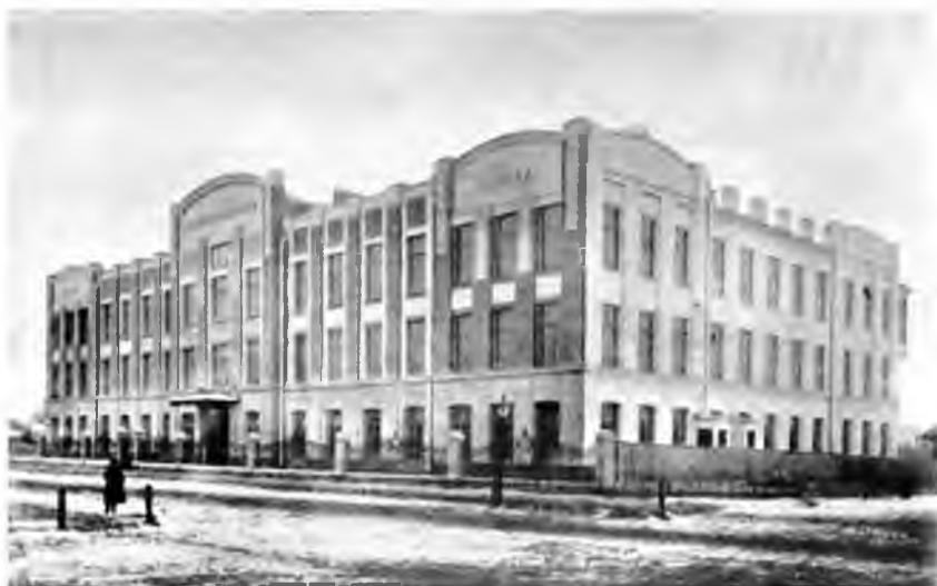
ФИЗИКО-ХИМИЧЕСКИЙ ИНСТИТУТ. Высших Женских Курсов, г. Москва.

И только в конце XIX века происходит перелом в общественном осознании так называемого женского вопроса. Женщины начинают активно посещать лекции в университетах в качестве вольнослушательниц. Наконец, в 1870–1890-х годах начинают появляться публичные курсы для женщин. А в 1900 году указом его императорского величества в Москве открываются Московские высшие женские курсы (МВЖК), которые наряду с «бестужевскими» курсами в Петербурге