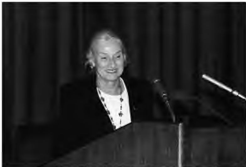
Фото М. Грюнберг-Манаго на Международном симпозиуме «Научное наследие Луи Пастера и современность. К 100-летию со дня смерти Луи Пастера» (Москва, Президиум РАН, 16–17 октября 1995 г.)