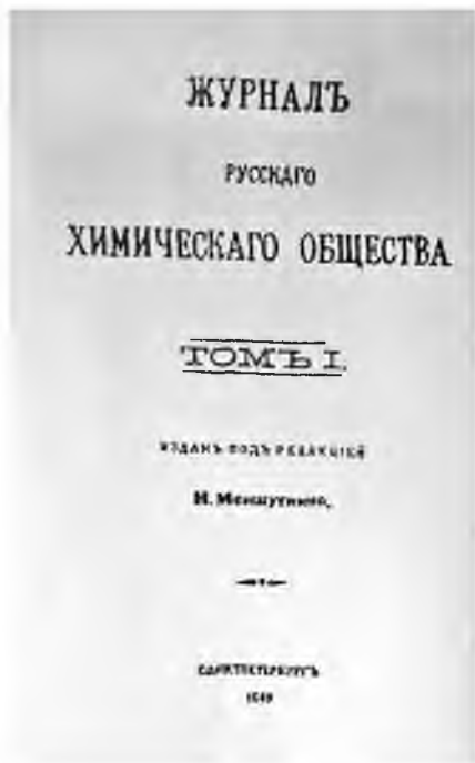
В журнале «Русского химического общества» печатались научные статьи Ю.В. Лермонтовой

«О получении нормального бромистого пропилена» [8. С. 241–281]. В результате проделанного исследования она сумела достичь при температуре 170^{\circ}\text{C} оптимальных условий образования триметиленбромид с «наилучшим выходом». Таким образом, ею был создан эффективный препаративный метод получения данного ценного органического соединения. В том же номере журнала опубликована статья профессора В.В. Марковникова «Об изомерных пировинных кислотах», в которой отмечено активное участие Лермонтовой в работе по синтезу глутаровой кислоты [9. С. 245–252].