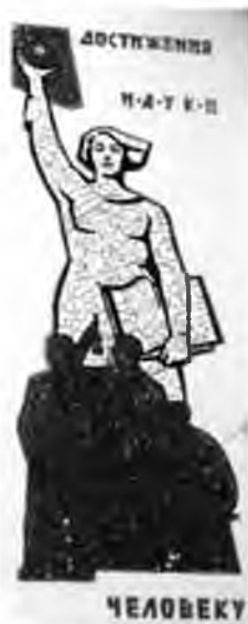
Рис. 2. Мозаика на фасаде Института биологии КНЦ УрО РАН, г. Сыктывкар

В целом для эпохи соцреализма 60–70-х гг. XX века в изображении науки и ученых характерен переход от изображения отдельных ученых (портретов), которых очень много в работах таких выдающихся российских художников конца XIX – начала XX века как И.Е. Репин, И.Н. Крамской, Н.Н. Ге, М.В. Нестеров, И.Э. Грабарь к изображениям неких обобщенных образов ученых. Картины становятся все более абстрактными, многофигурными и все чаще демонстрируют зрителю не конкретных ученых, а образ ученого, образ науки. Безусловно, портреты также имеют место, но это, как правило, портреты ученых-мужчин. Редким исключением в этом ряду являются портреты конкретных женщин-ученых (рис. 4).