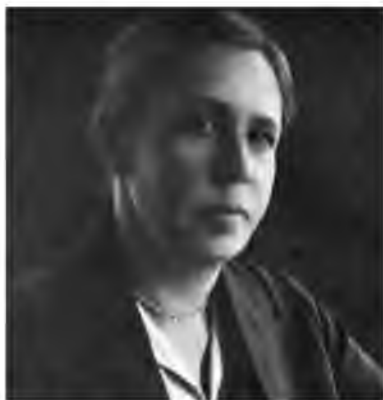
Баронесса Маргарет фон Врангель, графиня Андроникова (1930 г.) (Andronikow W. Margarethe von Wrangell: das Leben einer Frau 1876–1932; aus Tagebüchern, Briefen und Erinnerungen. München: Langen/Müller, 1935)

«Мои родители были из семьи Врангель, – писала в своих воспоминаниях М. фон Врангель [3. С. 141], – располагавшей многочисленными землями в двенадцатом веке в окрестностях Балтийского моря, а именно в Эстонии, Швеции и Пруссии, а также в районе Северного моря в Голландии <...>. Из истории семьи можно заметить, что многие из ее членов часто посвящали себя военной службе, например шведский военачальник Каролус фон Врангель (Carolus v. Wrangell), который участвовал в тридцатилетней войне, прусский фельдмаршал граф