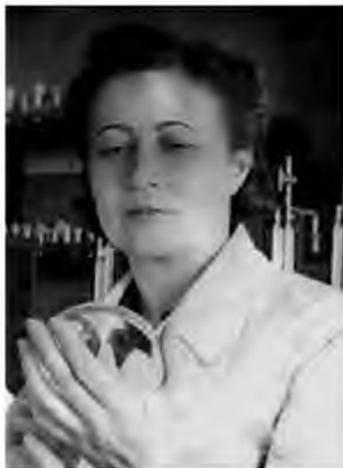
Зинаида Виссарионовна Ермольева в лаборатории. 1920-е гг.

Биография Ермольевой была полна опасными командировками. В 1939 г. началась эпидемия холеры в Афганистане. Советские власти начали организацию профилактических мер, чтобы зараза не попала в среднеазиатские социалистические республики. В Ташкент была отправлена рабочая группа, которую возглавила Ермольева. Дети и взрослые, жители крупных городов и далеких аулов – все были под