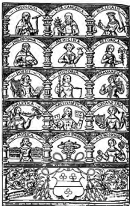
Рис. 3. Изображение женского облика науки