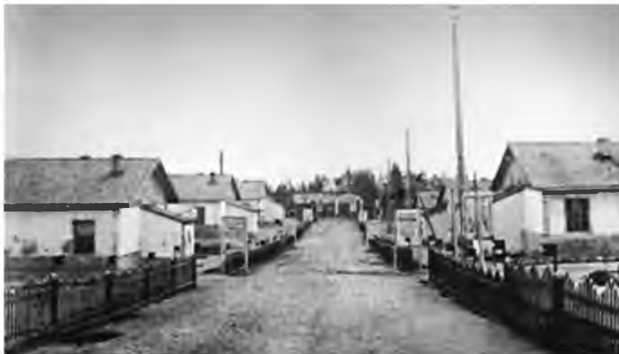
Баракы ИТЛага, Соликамск

Год 1946 – год возвращения в науку. Благодаря знакомству с Н.С. Курнаковым появляется возможность вести научную деятельность в стенах Института общей и неорганической химии АН СССР (ИОНХ). Работая там в течение двух лет, она изучала проблематику солей Карабугазского залива. Но довести исследования до логического конца не