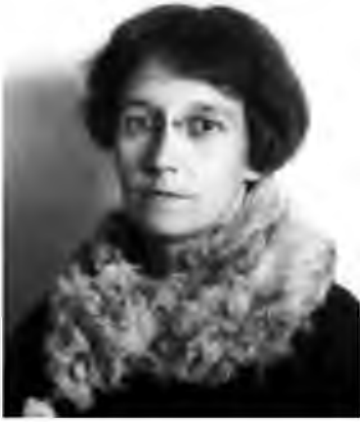
Елена Владимировна Антипова (1924)

ровны получили государственное признание – за свою неутомимую общественную деятельность она удостоена звания почетного гражданина одного из самых крупных и богатых штатов страны Минас-Жерайс, ордена Южного Креста и медали «За заслуги в области образования», врученной лично президентом Бразилии, ей стоит памятник. Сегодня в Бразилии действуют научно-исследовательский институт и образовательный фонд ее имени (Foundation Helena Antipoff/FNA), издано пять томов ее научных работ и материалов общественных инициатив на португальском языке.