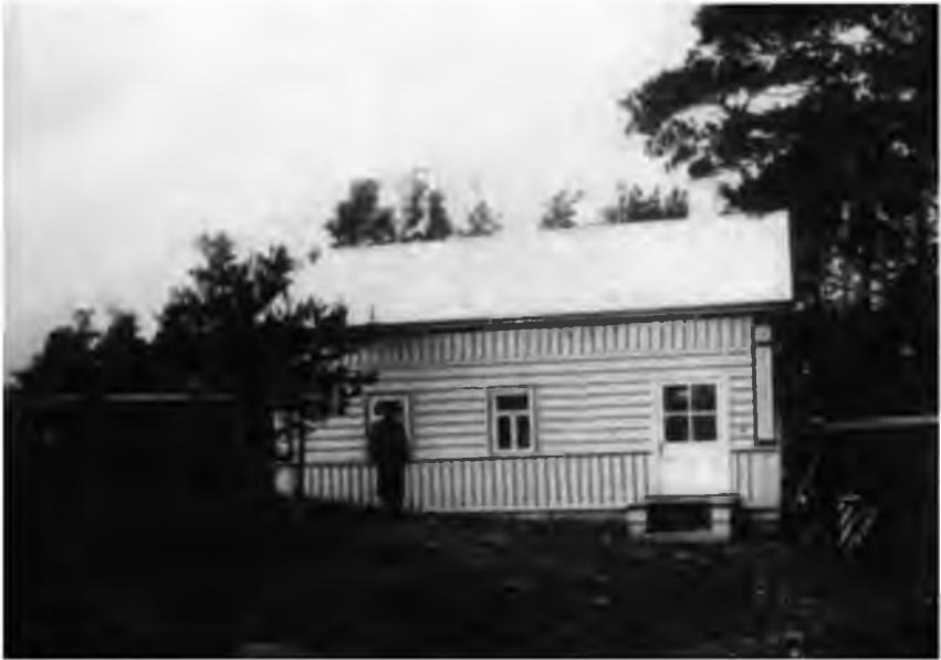
Рис. 2. Здание сейсмической станции, Екатеринбург, 1906 г.

1906 года. Координаты сейсмической станции «Екатеринбург» – «Свердловск» 56^{\circ}49'38'' N 60^{\circ}38'14'' E, высота над уровнем моря 277,303 метра (рис. 2).