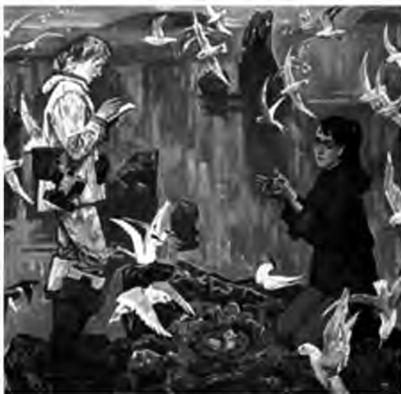
Рис. 1. В.М. Петров-Маслаков. «Ученые. Заповедное Беломорье»