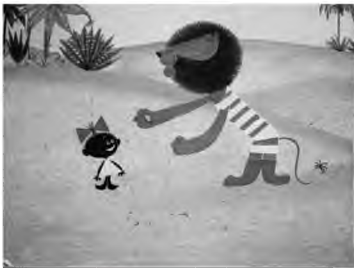
Рис. 2. Из мультфильма «Каникулы Бонифация»

руку. Я опешила – после такого сражения! И ответила: «Вы можете меня задавить, но после всего, что произошло, я подать вам руки не могу». Окружающие замерли, и я услышала тихое: «Вас задавишь... ». Но на следующий день последовал вызов в дирекцию и «приговор»: «Вы у нас в институте работать не будете!». Тогда в моем секторе над моим столом и появилась картинка (см. рис. 2). (Но, вполне возможно, начальство о ней так и не узнало или не обратило внимания).