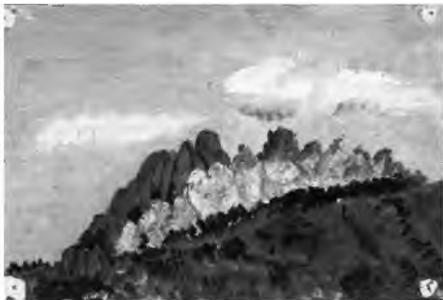
Рисунок М.В. Павловой, выполненный масляными красками. Начало XX в.

М.В. Павлова поддерживала тесные научные и дружеские контакты с учеными по всему миру. Например, в течение 20 лет она переписывалась с Альбером Годри (Albert Gaudry), французским геологом и палеонтологом, лекции которого произвели на нее огромное впечатление еще во время учебы в Париже [3; 4]. Среди других иностранных