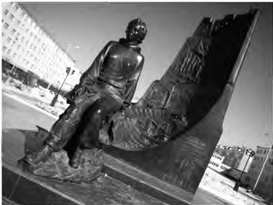
Памятник Ларисе Попугаевой в городе Удачном, Якутия-Саха