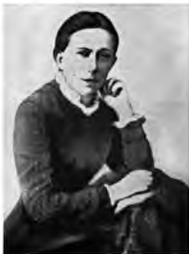
Юлия Всеволодовна Лермонтова (1847–1919)