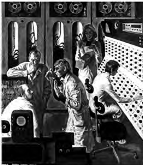
Рис. 5. В.И. Рыжих. «Поиск»