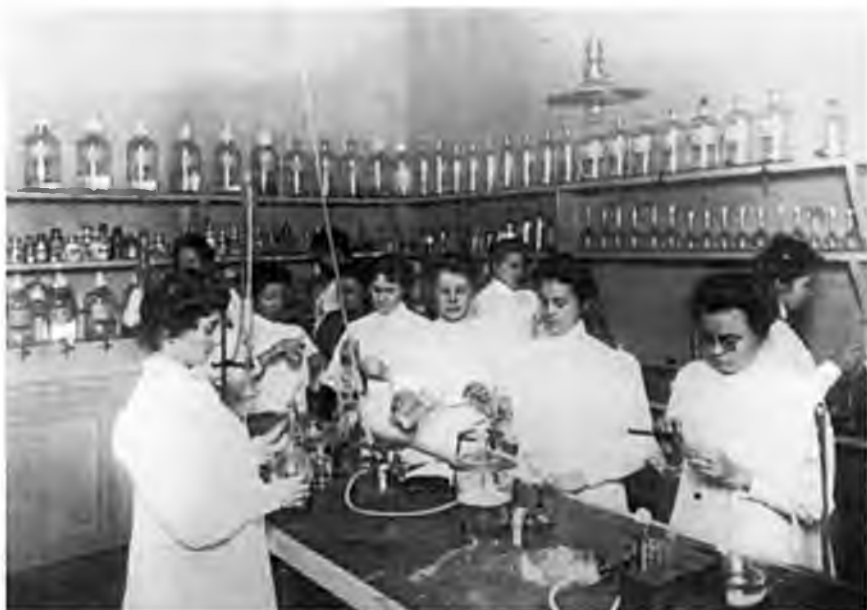
«В химико-аналитической лаборатории при Первой женской аптеке в СПб.» (1902)

Городовое положение 1870 г. давало право городским думам осуществлять санитарные меры, но не обязывало их это делать. Поэтому организация городского санитарного дела с неизбежностью стала делом профессиональных сообществ и общественных структур. Структурой,