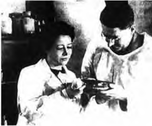
З.В. Ермольева и сэр Говард Флори. 1944 г.

раненых с сепсисом, находившихся в одинаково тяжелом состоянии. И хотя отечественный пенициллин – крустозин был менее очищен и его применяли в меньших дозах, эффект лечения был не хуже, чем при применении английского препарата. Флори, симпатизировавший женщине-ученой, звал ее «Госпожа Пенициллин». Но услышав, что коллеги называют Ермольеву «ханум» (из-за нескольких лет, проработанных в Азии), переименовал в «Пенициллин-ханум».