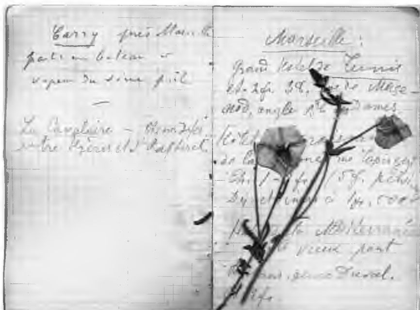
Записная книжка М.В. Павловой за 1900 г. Записи сделаны во время поездки во Францию на Международный Геологический конгресс (Архив РАН)

Опись 2 хоть и называется «Биографические документы М.В. Павловой», состоит преимущественно все из тех же научных дел (32 ед. хр.). Здесь есть лекции и статьи по палеонтологии, рукописи, папки с рисунками и зарисовками, фотоснимки, каталоги коллекций, сводные таблицы; разрозненные письма, приглашения, билеты; фото-