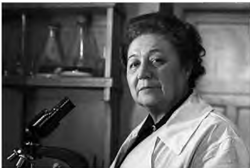
З.В. Ермольева. 60-е гг.

С 1945 по 1947 г. З.В. Ермольева – директор Института биологической профилактики инфекций. В 1947 г. на базе этого института был создан Всесоюзный научно-исследовательский институт пенициллина (в последующем Всесоюзный научно-исследовательский институт антибиотиков), в котором она заведовала отделом экспериментальной