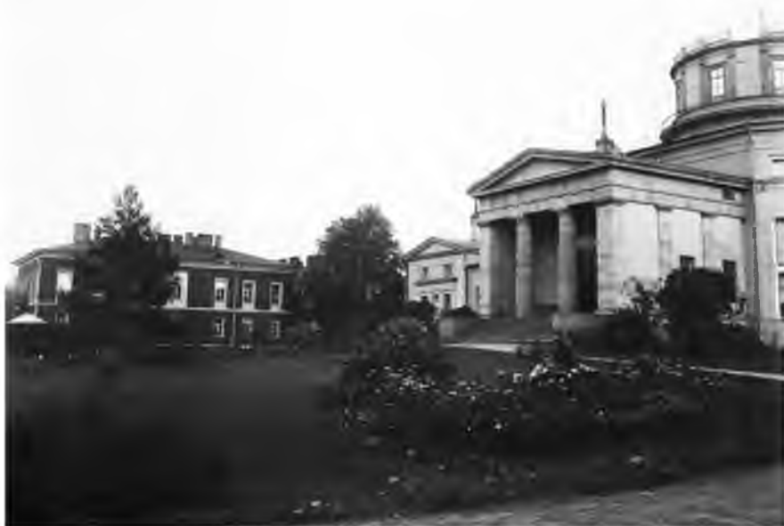
Пулковская обсерватория. Вид на центральную часть Главного здания и Восточный корпус. [1930-е гг.]