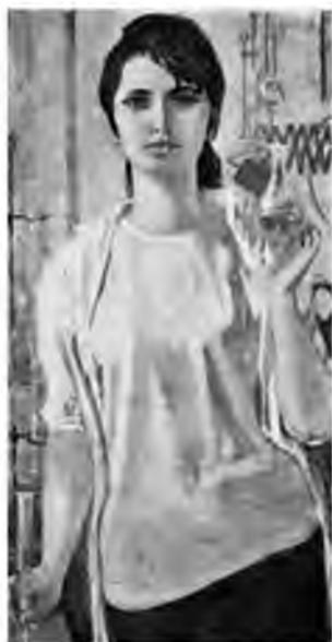
Рис. 8. А.Н. Самохвалов. «В лаборатории»