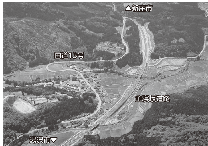
中田地区内の道路