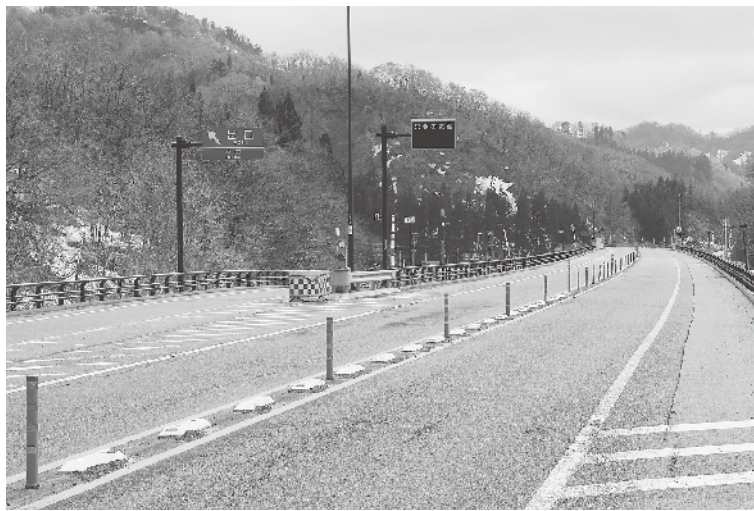
上中田地内の高規格道路