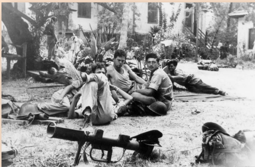
לוחמים מחטיבת יפתח נחים בבן שמן בהפוגה בין קרבות

מבצע דני היה המבצע הגדול והחשוב ביותר בחזית המרכז בקרבות 'עשרת הימים', בימים 18-10 ביולי 1948. המבצע נועד לשחרר את ירושלים ואת הדרך אליה על-ידי תקיפת כוחות הלגיון הירדני באזורים לוד-רמלה-לטרון-רמאללה. תחילה נקרא המבצע "לרל"ר" (ר"ת של ארבעת המקומות הנ"ל), מאוחר יותר שמו למבצע-דני' על-שם דני מס, מפקד מחלקת הל"ה.