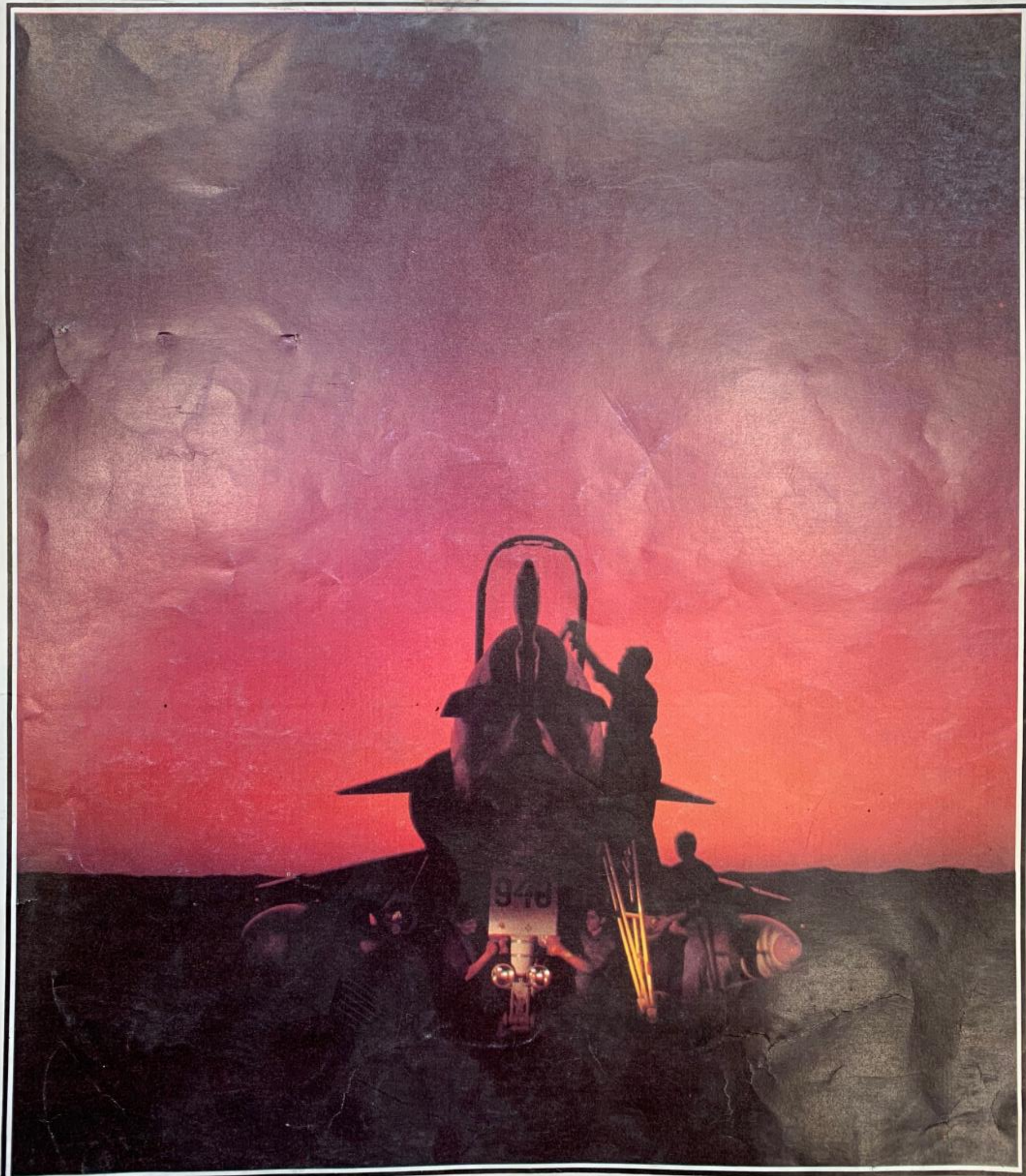
בטייסת, לעת ערב.

עתון חיילי ישראל ■ גליון מס' 42 ■ א' אב תשמ"ב ■ 21.7.82 ■ המחיר 11 ש"ח