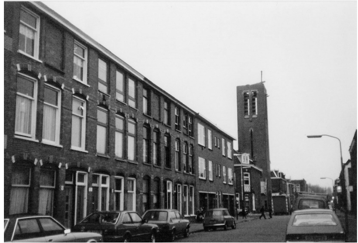
De sloop van de kerk