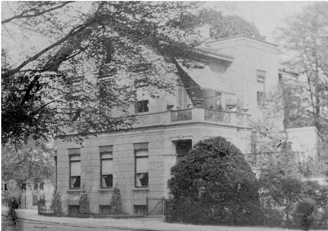
Kennemerplein 5, Het latere "Svenska Restaurangen 't Bolwerk" gebouwd door J.D. Zocher in 1869. Beeldbank van het Noord Hollands Archief.

Uit de nalatenschap van de heer Th. Kooijman. Bron: Noord Hollands Archief; krantenberichten Haarlems Dagblad; Ds. P. Kroes. Foto's en samenstelling: Theo Kooijman