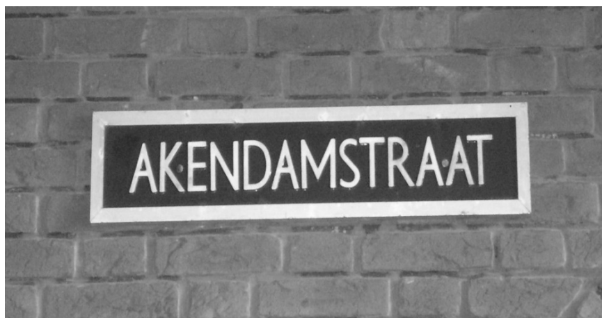
Akendamstraat RB Haarlem 17 juli 1929

B & W Besluit van Burgermeester en Wethouders van Schoten of Haarlem RB Raadsbesluit van Schoten of Haarlem.