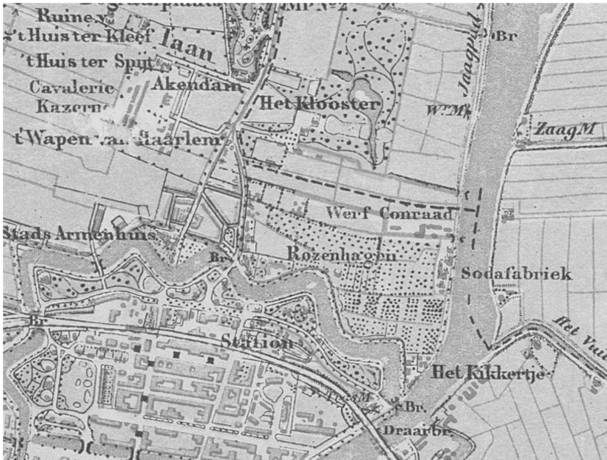
De tuinderij Rozenhagen van Zocher aangegeven op een kaart uit 1890.

In 1817 vestigt Zocher zich in Haarlem, onder andere om zich te bekommeren om de vervallen kwekerij Rozenhagen die hij heeft geërfd van zijn vader.