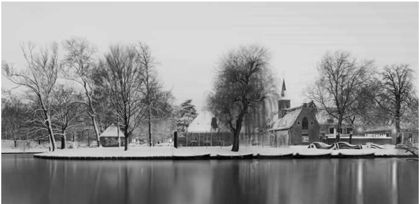
Het Bolwerk met het Dolhuys in de sneeuw. December 2017.

2018, een nieuw jaar. Denkt u aan betaling van uw jaar donatie?