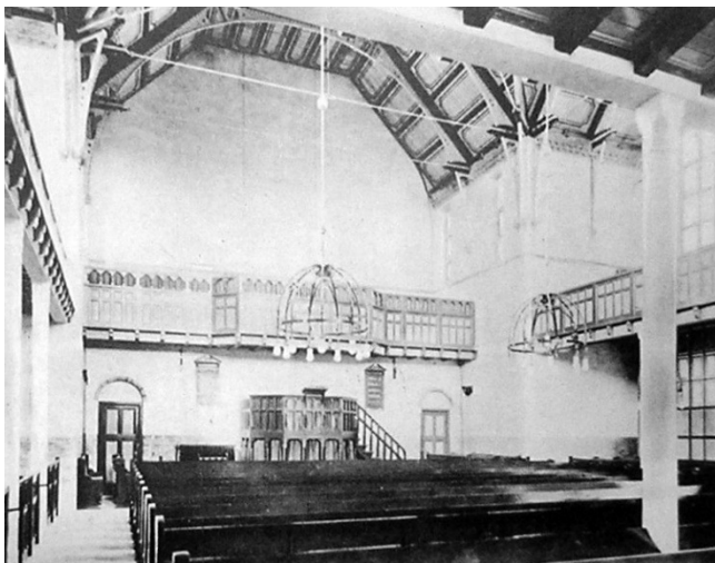
interieur van de kerk

Ook liep er een onderaardse gang langs dit gedeelte van de Kloosterstraat, die vlak bij de Gedempte Schalk Burgergracht uitkwam. Een vluchtgang van het voormalige klooster?