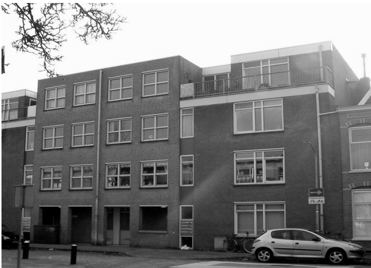
De kerk is verdwenen. Er staan nu appartementen.

In het Haarlem Dagblad in 1984 werd geschreven: