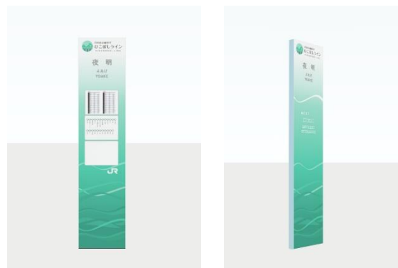
駅サイン イメージ