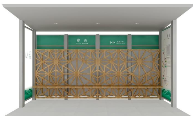
待合ブース イメージ

一部のBRT駅に設置する待合ブースには、駅ごとに木材を活用して地域の特色を表現し、独自性に溢れた温かみのある空間を創り出します。その他のBRT駅には、添田町、東峰村、日田市をイメージした、BRTひこぼしラインオリジナルの駅サインを設置し、沿線の一体感を創出します。