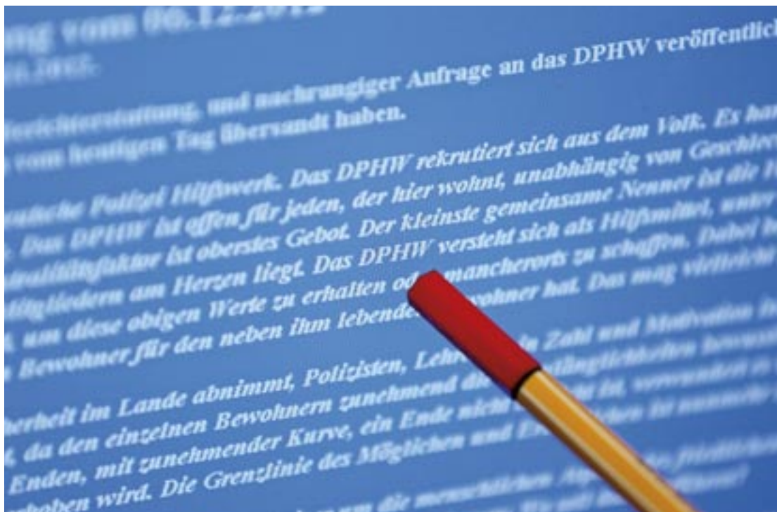
Blick auf eine Pressemitteilung des DPHW, welche im Internet veröffentlicht wurde.

Der Verfasser ist ein ehemaliges Mitglied des „Deutschen Polizei Hilfswerks“ (DPHW) 4 und gehört dem „Reichsbürger“-Spektrum an. Auf 464 Seiten bearbeitet er gängige „reichsideologische“ Annahmen.