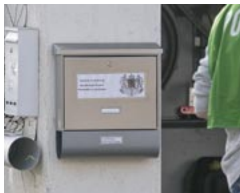
Polizei-Einsatz bei der Organisation „Bundesstaat Bayern“ im Februar 2017 in Bayern.

Im Jahr 2017 führten staatliche Stellen zahlreiche Entziehungsmaßnahmen durch. Nachstehend werden einige herausragende Beispiele von Exekutivmaßnahmen gegen „Reichsbürger“ bzw. „Selbstverwalter“ thematisiert, bei denen auch Schusswaffen aufgefunden und sichergestellt wurden: