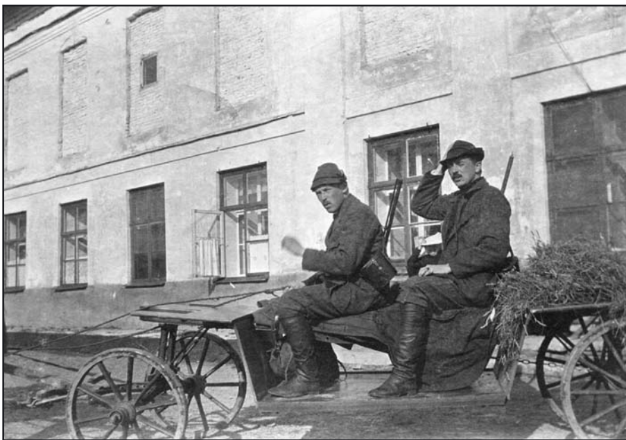
Perepojad mõisa ees 1917. aastal

Sirvides XIX sajandi lõpu ajalehti, võib leida mitmesuguseid huvitavaid fakte. Kui tsaaririigis kehtestati sajandivahetusel riiklik viinamonopol ja enamikus kohtades alles taotleti 'rahvavaenlastest' kõrtside sulgemist, siis Valgu mõisas olid selleks ajaks kõik kõrtsid mõisniku korraldusel juba suletud, muudetud poodideks või millekski muuks. Veel olid Valgu mõisas üle-eestimaaliselt tunnustatud hobused. Näiteks „Eesti Postimehe“ teatel võitis 'Eestimaa põllumeeste seltsi poolt 22.–25. juunil 1896 Tallinnas ära peetud põllu- ja käsitöö väljanäitusel' ratsahobuste arvestuses suure hõbeaura-