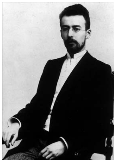
ZAIKS Warsaw/Arch. For PWM