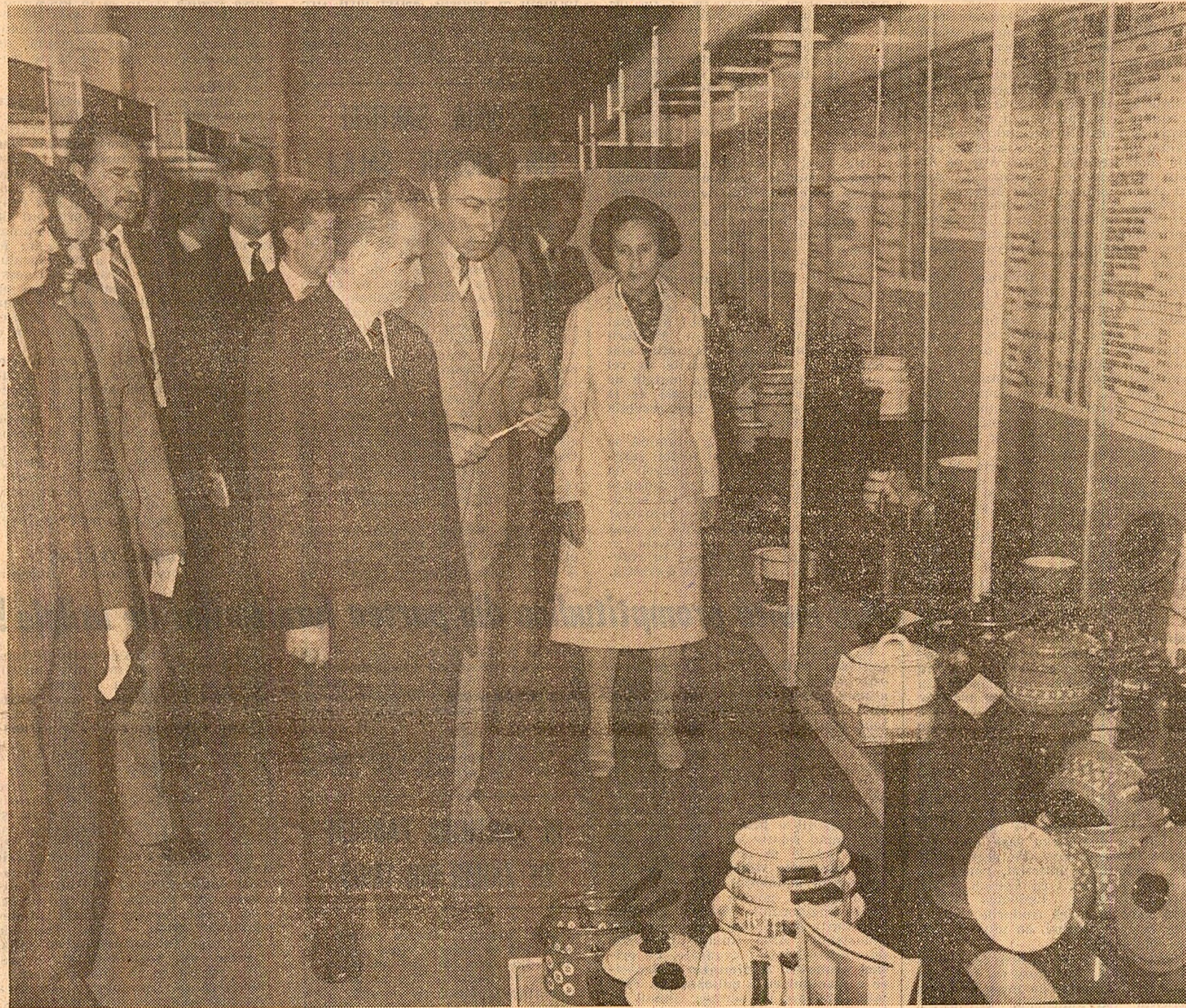
În timpul analizei la standul industriei ușoare

a analizat ieri, în continuare, cu cadre de conducere și specialiști din industrie, probleme fundamentale ale ridicării eficienței întregii activități economice