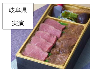
<金亀館>飛騨牛ステーキ &カルビ弁当