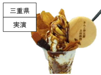
<きんこ芋工房 上田商店> きんこ芋と芋蜜のパフェソフト