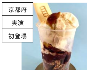
<梅園 oyatsu> みたらしパフェ