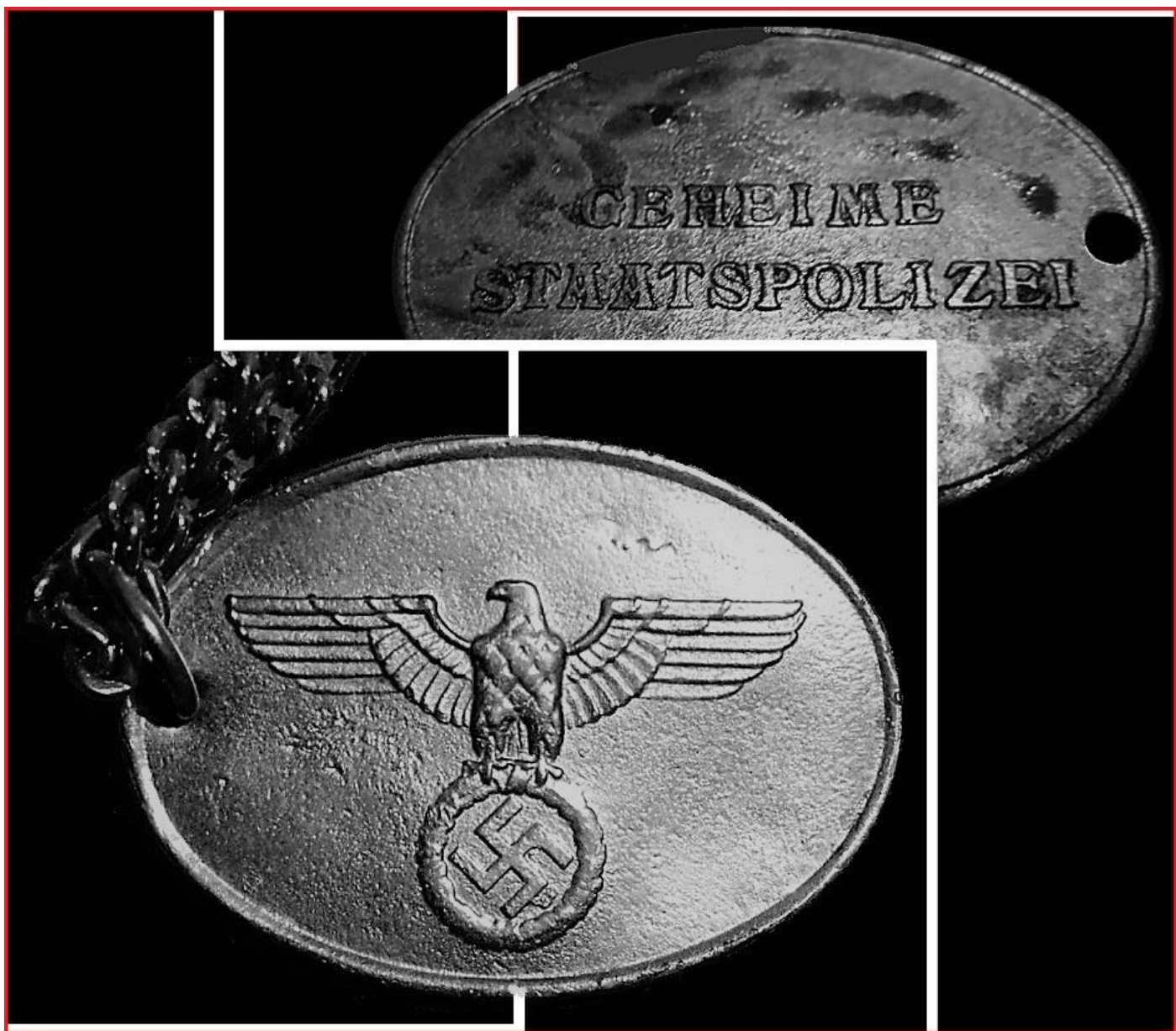
GESTAPO – služební odznak.

Protektorát Čechy a Morava byl formálně autonomní součástí Německé říše. Velmi rychle se v něm etablovala i nacistická okupační správa, včetně obávané tajné státní policie (geheime staatspolizei - GESTAPO). Její řídicí úřadovna v Praze se usadila v „arizovaném“ Petschkově paláci v Bredovské ulici č. 20 (dnes ul. Politických vězňů) a zahájila intenzivní činnost.