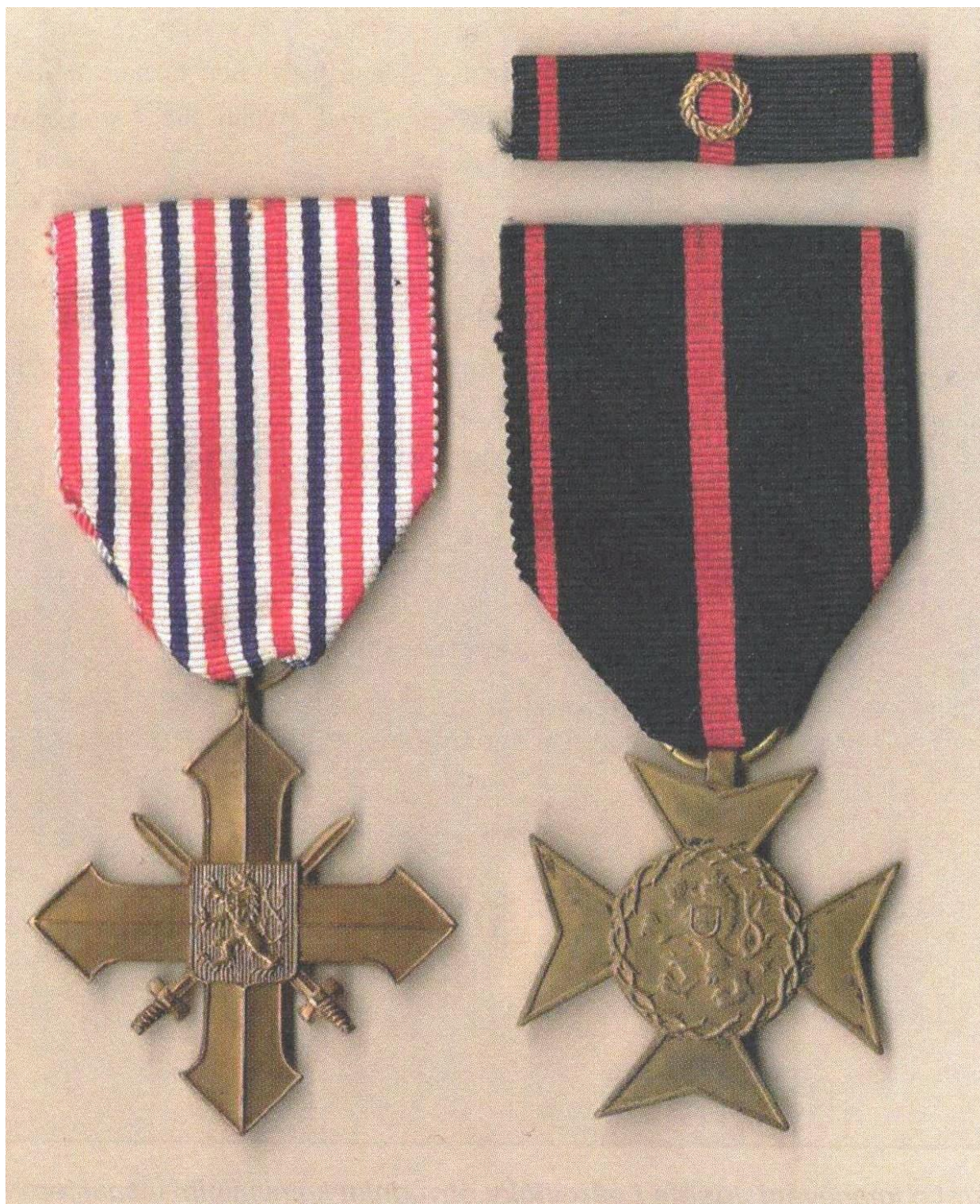
Vyznamenání, udělená in memoriam Josefu Laštovičkovi: Československý válečný kříž 1939 Pamětní odznak Svazu osvobozených politických vězňů a pozůstalých