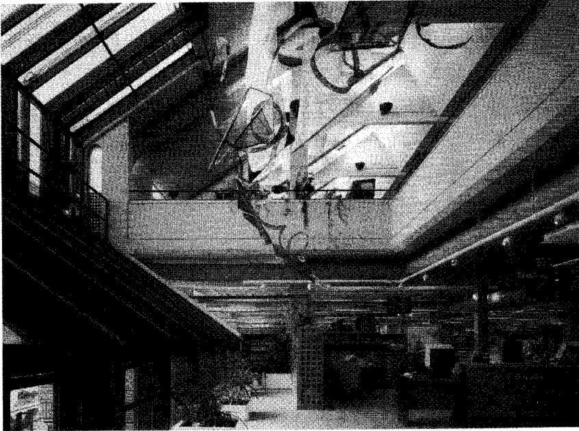
▲圖三 卡來爾市立圖書館一樓大廳