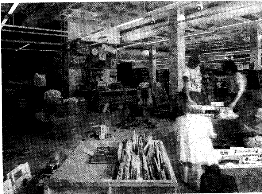
▲圖四 兒童圖書館乾濕兩區可以用窗簾隔開