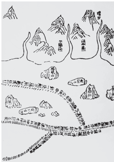
明永乐时的东洛（今北鹿）位置图