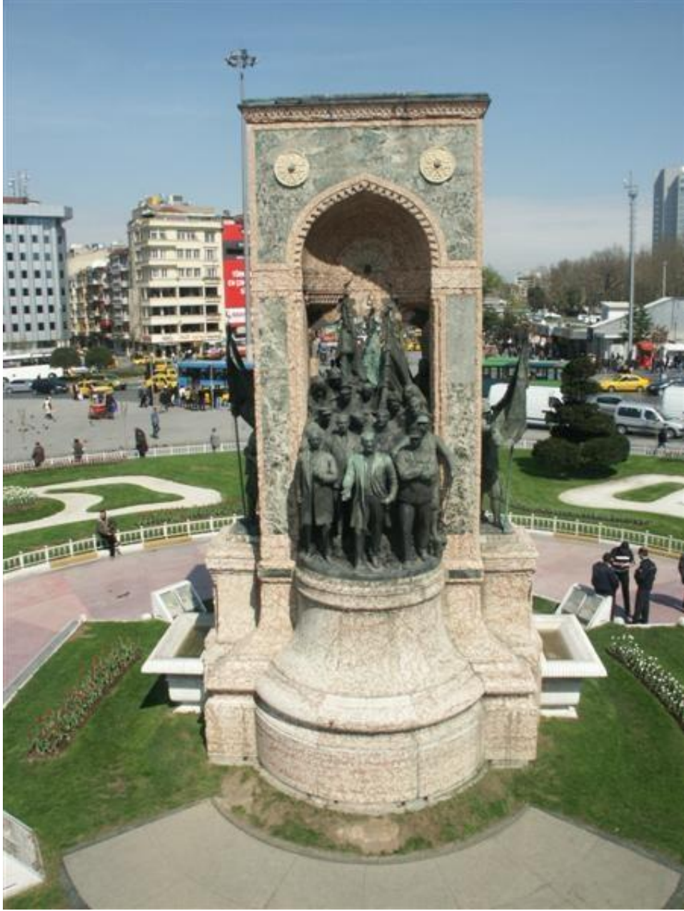
Resim 7. Taksim Âbidesi