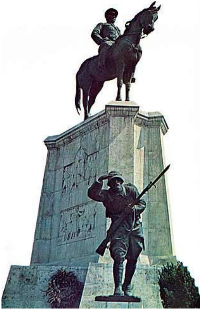
Resim 8. Yenigün – Ulus Zafer Anıtı (www.wowturkey.com)