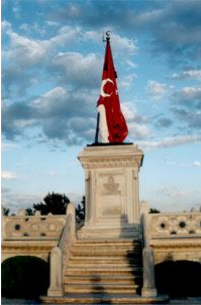
Resim 5. Şehit Sancaktar Mehmetçik Heykeli/Dumlupınar ( www.wowturkey.com )