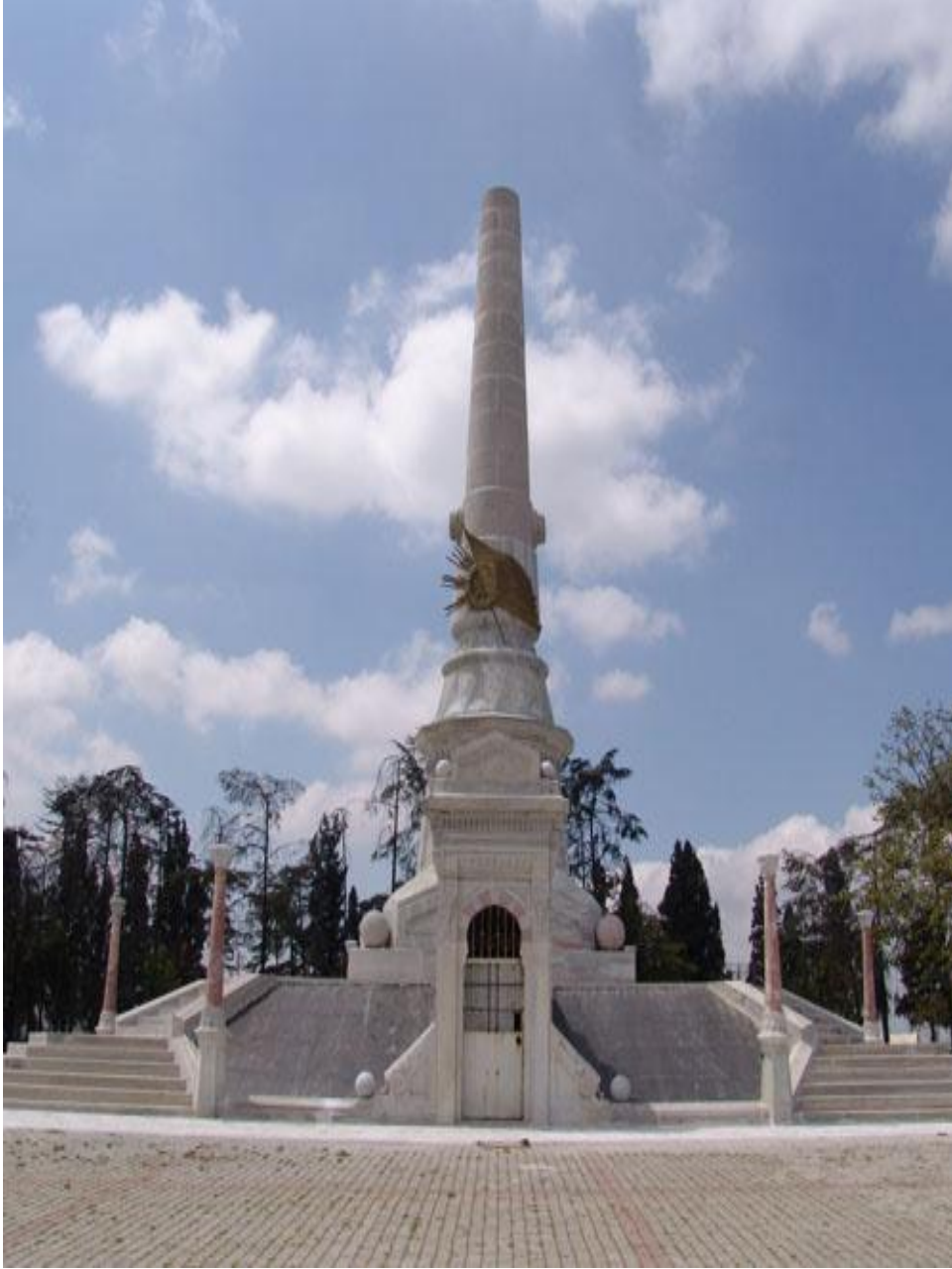
Resim 4. Abide-i Hürriyet Anıtı