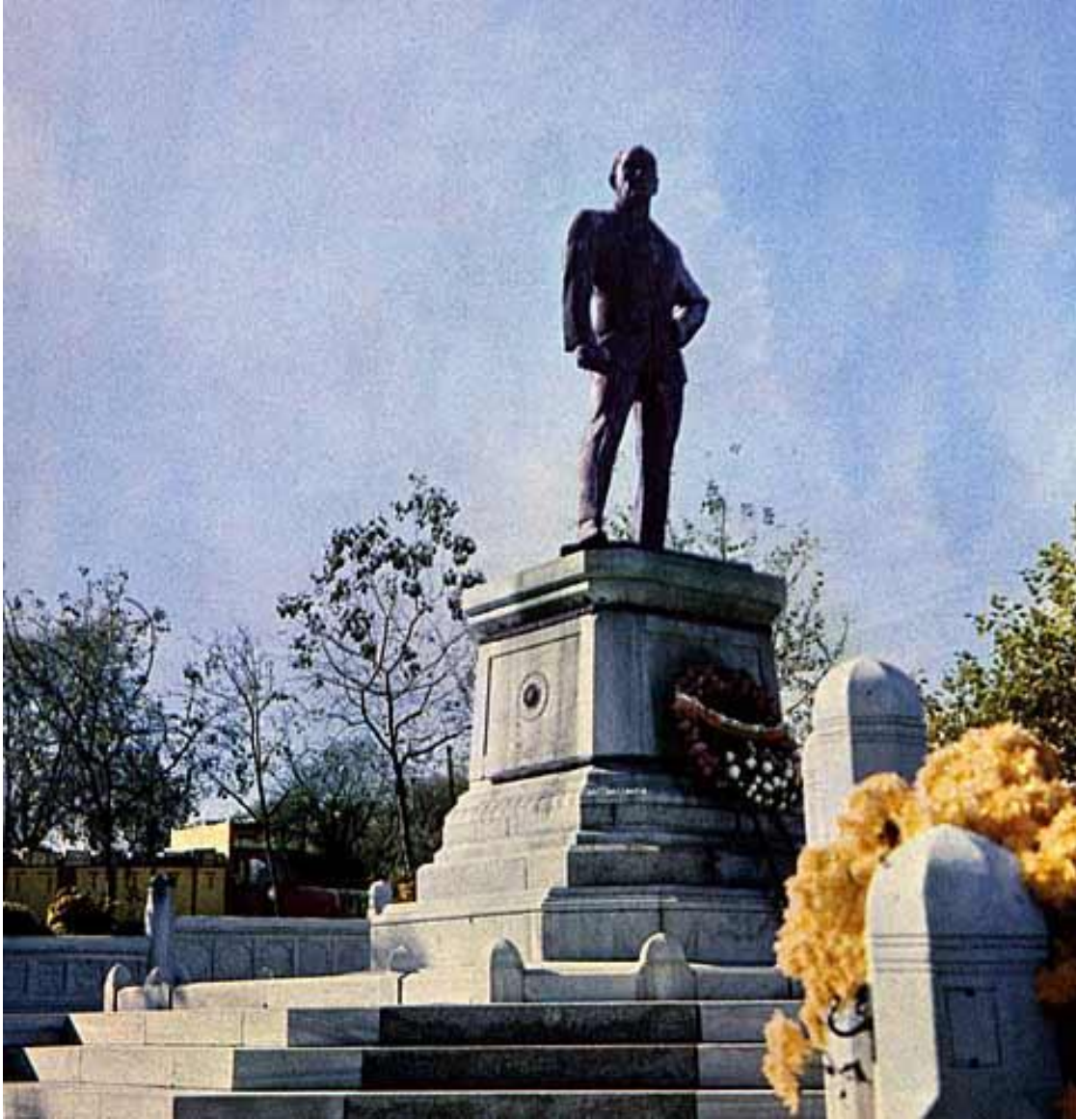
Resim 6. Sarayburnu Atatürk Heykeli