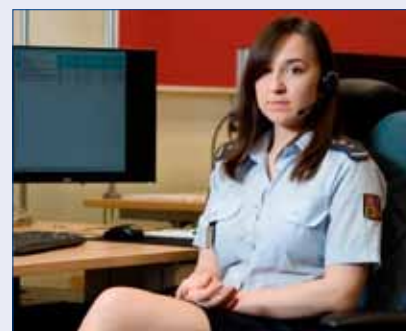
■ Hovory z tísňových linek 112 a 150 se přijímají na Krajském operačním informačním středisku Hasičského záchranného sboru Středočeského kraje na Kladně. V příslušné stanici se následně rozezní rozhlas a vytiskne se příkaz k výjezdu s určenou technikou.