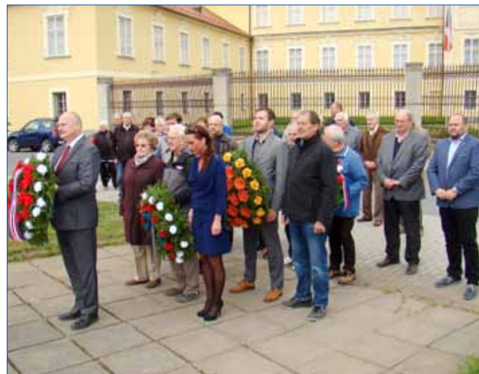
■ K pomníku Obětovaný Hořovičtí položili věnce a květiny.