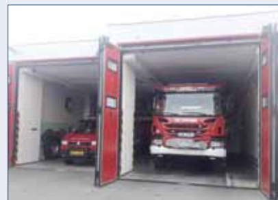
■ Hasiči vyjíždějí k zásahu do dvou minut od vyhlášení poplachu. Dojezdový čas do nejvzdálenějších míst je do 20 minut. V rámci města Hořovice je to 7 minut, vždy pro první jednotku.