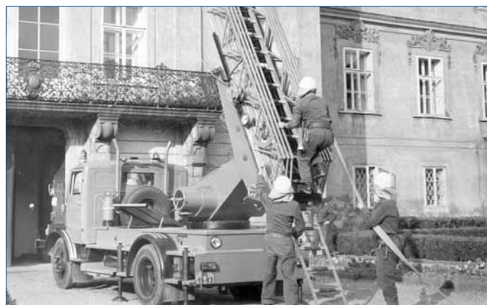
■ Fotografie z požárního cvičení na Novém zámku, 1980

„Oheň - dobrý sluha, špatný pán“ je téma 1. muzejní noci, která se uskuteční v pátek 14. červ-