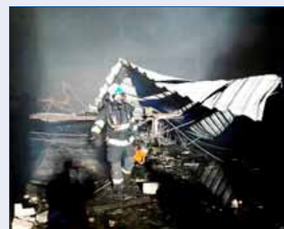
■ Hasební obvod HZS Hořovice pokrývá většinu území Obce s rozšířenou působností Hořovice. Zahrnuje i do ORP Beroun, Příbram, Rokycany, a to s ohledem na dojezdové časy.