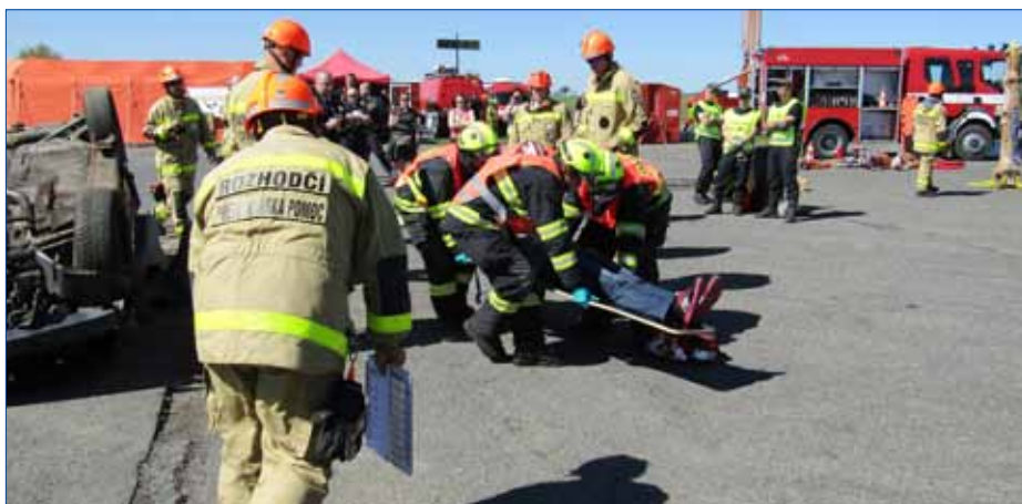
■ Krajská soutěž ve vyprošťování u dopravních nehod byla zároveň pátým ročníkem Velké ceny Hořovic. Na snímku tým hořovických hasičů v akci.