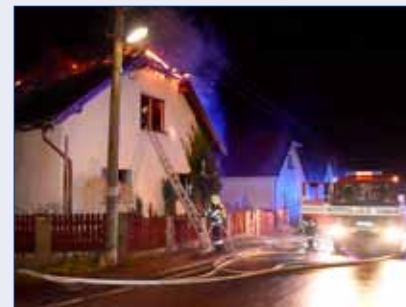
■ Stanice HZS Hořovice má ročně v rámci svého hasebního obvodu přibližně 400 výjezdů na různé druhy událostí.