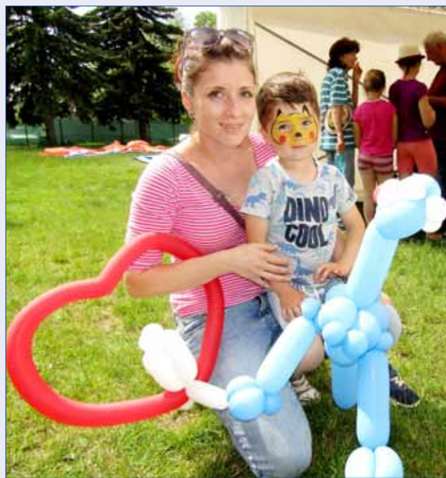
■ Májové odpoledne s Mikroregionem Hořovicko se uskutečnilo poslední květnovou nedělí v zahradě Společenského domu. Pestrý program potěšil malé i velké návštěvníky. Užili si pohádkové zpívání, vystoupení mažoretok Domečku Hořovice, loutkovou pohádku O Popelce i skákací hrady nebo tvořivou dílnu. Nechybělo občerstvení.