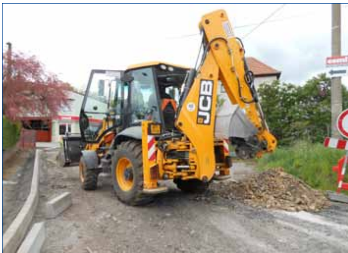
Ulice Vilová.

S dokončením stavebních prací se počítá koncem prázdnin.