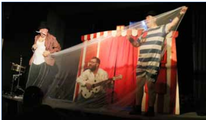
■ Hostem Hořovického kulturního léta bude i Divadlo Na holou, jehož herci uvedou v neděli 23. června na nádvoří Starého zámku hru Všetečka. Snímek vznikl při květnové premiéře v klubu Labe.