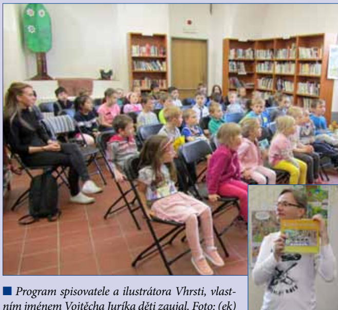
■ Program spisovatele a ilustrátora Vhrsti, vlastním jménem Vojtěcha Juríka děti zaujal.

V pátek 26. dubna do hořovické knihovny již poněkolidkaté zavítal spisovatel, ilustrátor a kreslíř Vhrsti, vlastním jménem Vojtěch Jurík. Pro děti připravil zajímavý program, který doprovodil svými ilustracemi. Nechyběl drak, princezna, princ a hlavně dobrý konec. Jeho knihy si můžete zapůjčit i u nás v knihovně, například i Bílou paní na hlídání, která se stala oblíbeným Večerníčkem. Na autora se přišly podívat desítky dětí ze tří tříd hořovické mateřské školky. (red)