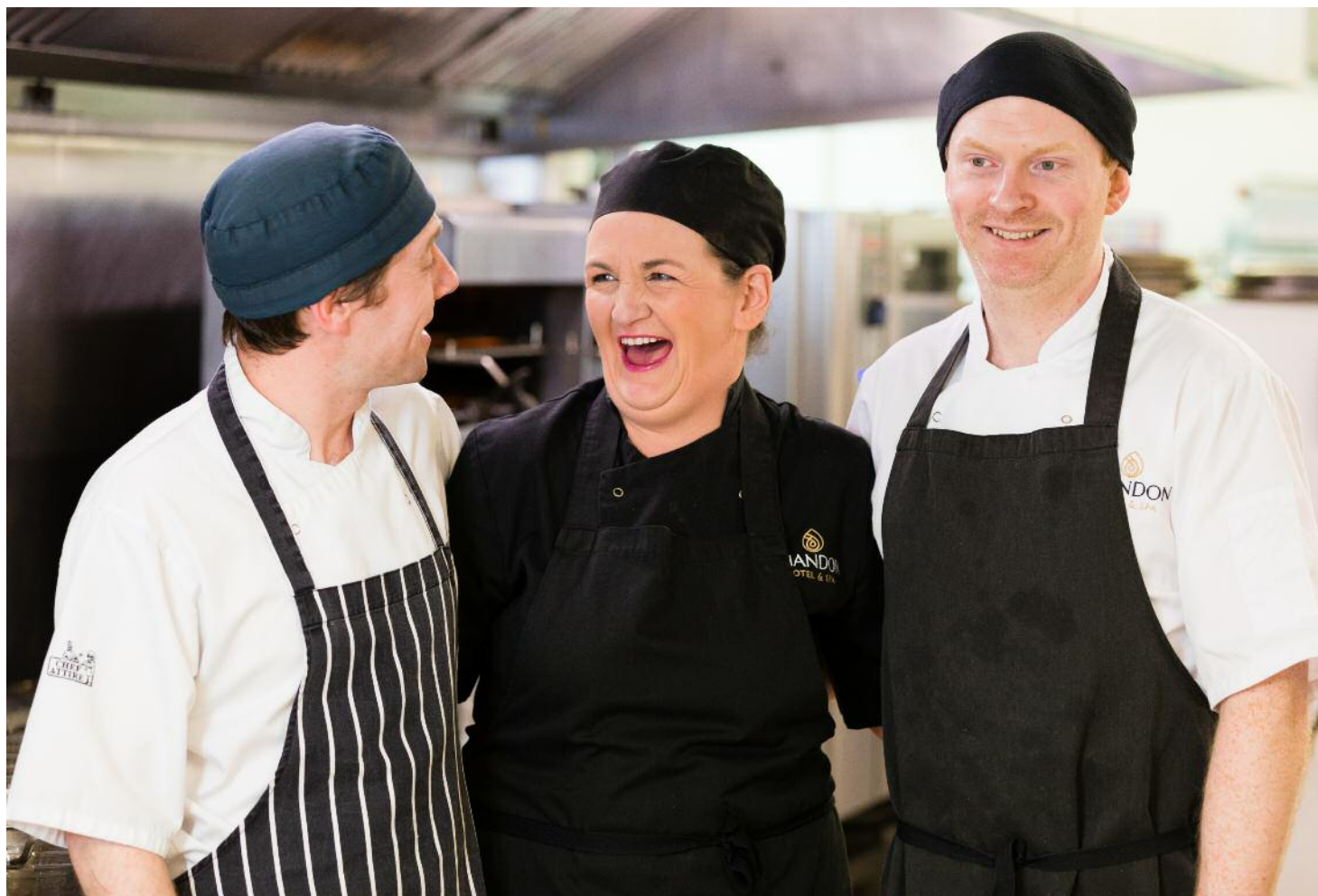
An Shandon léirithe ag Paper Owl Films