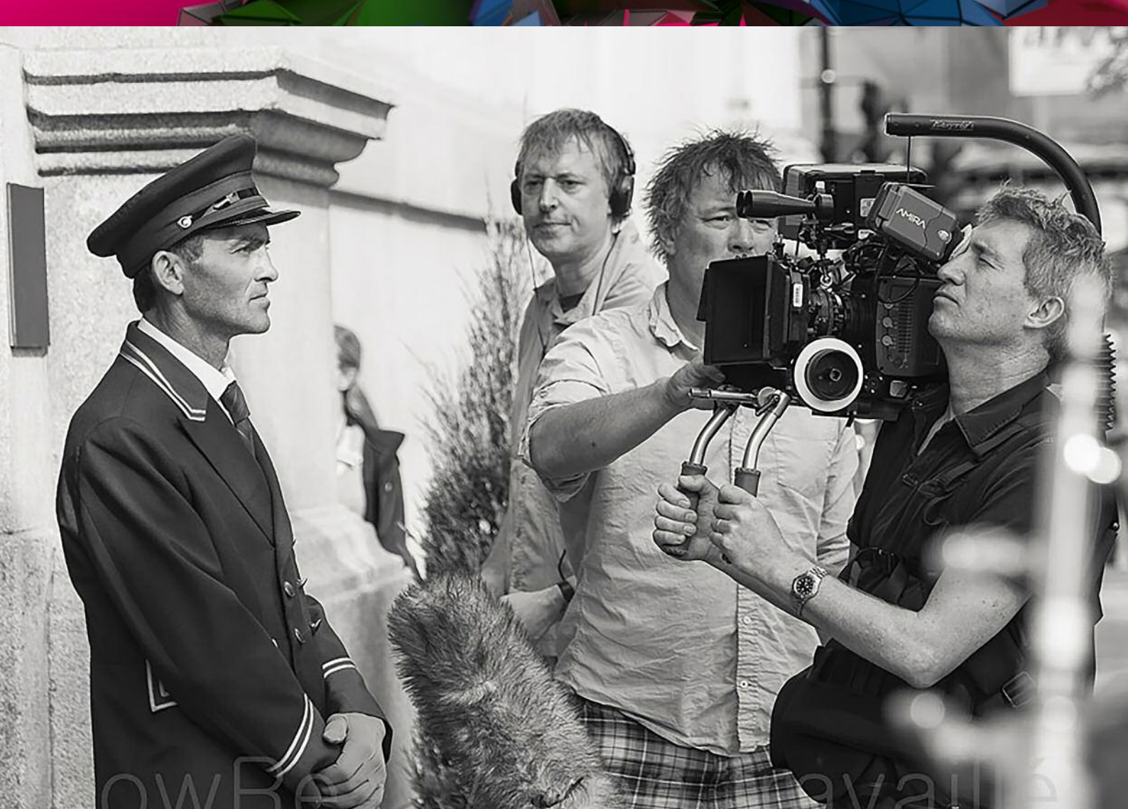
Song of Granite léirithe ag Roads Entertainment