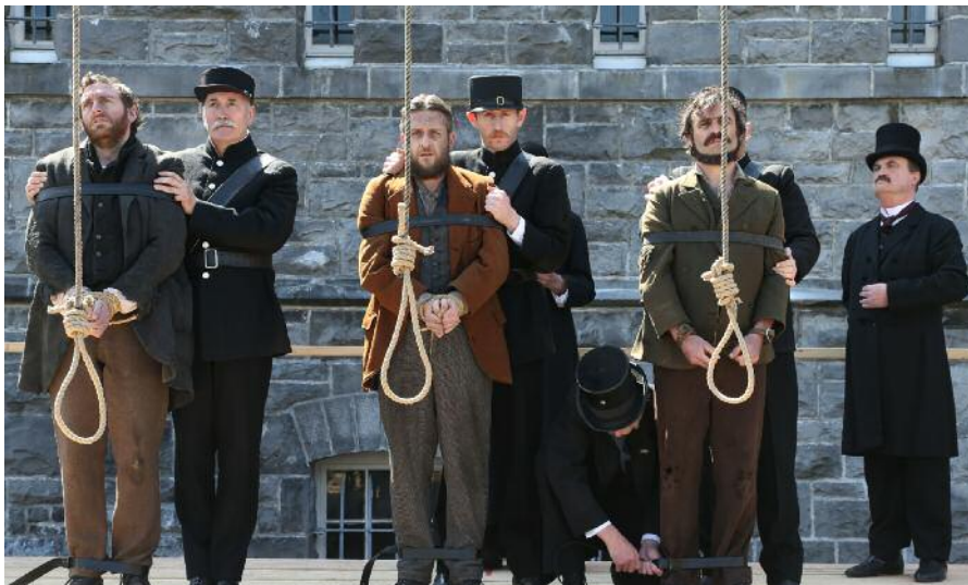
Murdair Mhám Trasna léirithe ag Rosg Teo.

Gaeilge. Táthar an-bhuíoch as an gcistíocht bhreise a fuarthas ón Roinn Cumarsáide, Gníomhaithe ar son na hAeráide agus Comhshaoil a chuir ar ár gcumas na tionscnaimh seo maidir le Bliain na Gaeilge a chur i gcrích.