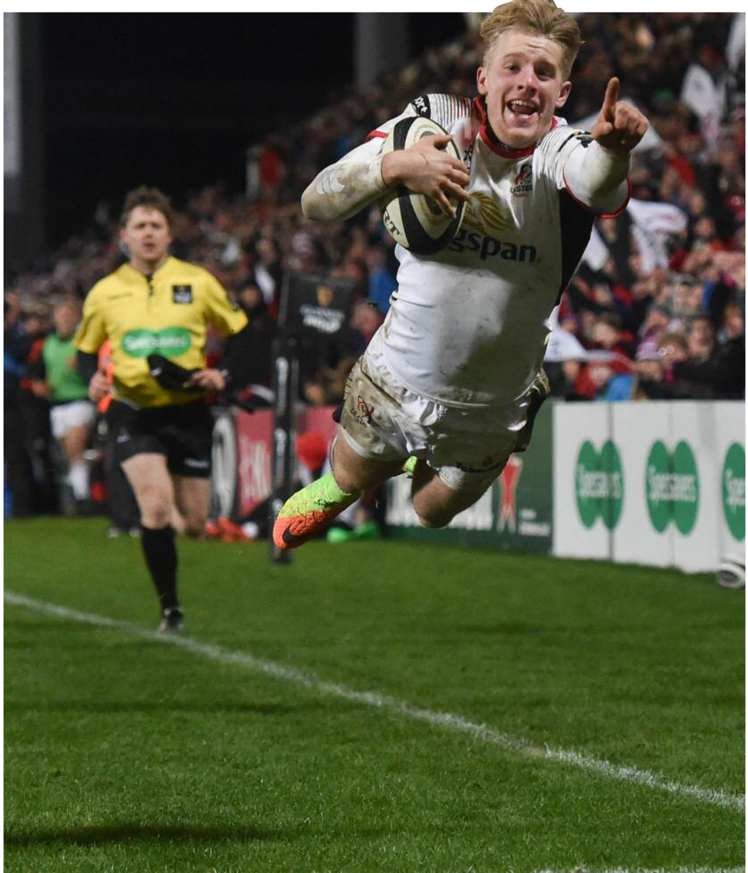
Rugbaí Beo léirithe ag Iris Productions