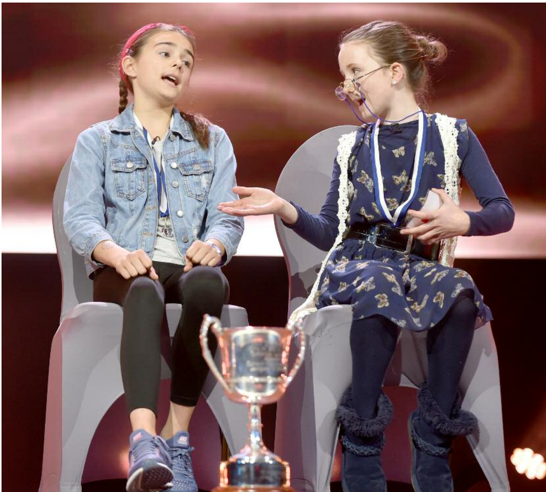
Lárstáitse ag Oireachtas na Samhna 2018