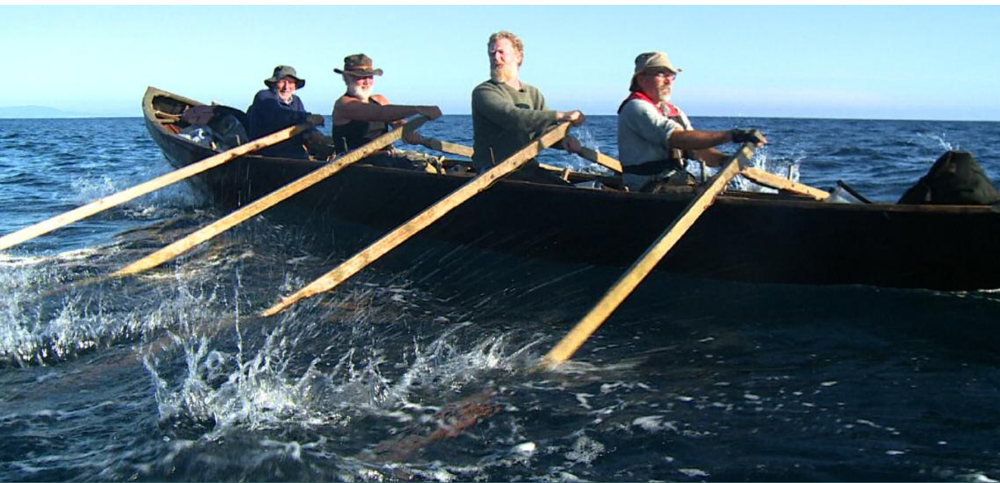
Iomramh an Chamino le Anú Pictures