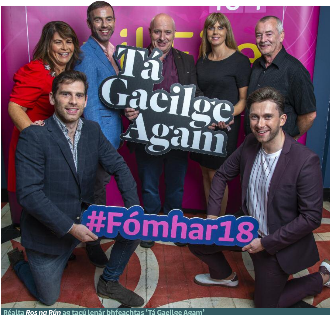
Réalta Ros na Rún ag tacú lenár bhfeachtas ‘Tá Gaeilge Agam’