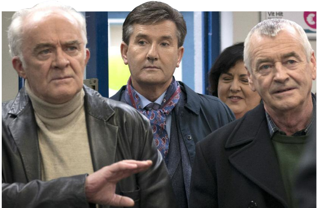
Ros na Rún léirithe ag Eo Teilifís & Léirithe Thír Eoghain

a chaitheamh ar chláir/ábhar i rith na bliana 2018. 1 €28.31m (73.2% den chaiteachas oibríúcháin) an infheistíocht a rinneadh agus níorbh fhéidir an méid sin a dhéanamh murach an chistíocht bhreise maidir le Bliain na Gaeilge a fuarthas ón Roinn. Ní féidir caiteachas chomh hard céanna a dhéanamh maidir le lón ábhair sa bhliain 2019 ó tharla gur €34.2m an chistíocht i leith na bliana 2019, 1.6% níos ísle ná leibhéal na bliana 2018.