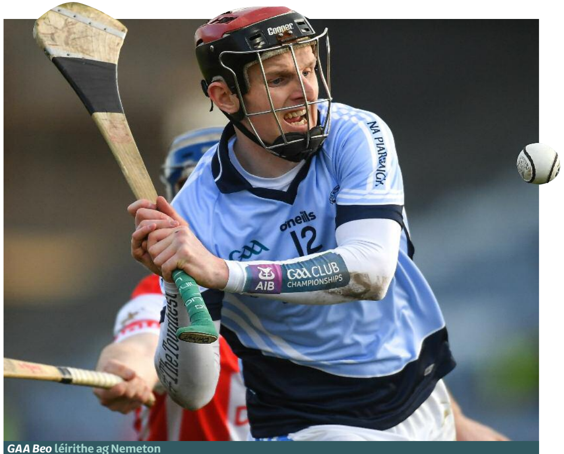
GAA Beo léirithe ag Nemeton

chur faoin nGaeilge agus an teanga a chur chun cinn. Tá 74% den dearcadh go gcruthaíonn TG4 an chuma go bhfuil an teanga níos nua-aimseartha agus ceangal níos mó aici leis an uile dhuine. Measann 92% go gcuideíonn TG4 leis an nGaeilge leis na cláir agus leis an lón ábhair agus measann 80% go gcuireann TG4 beocht sa teanga.