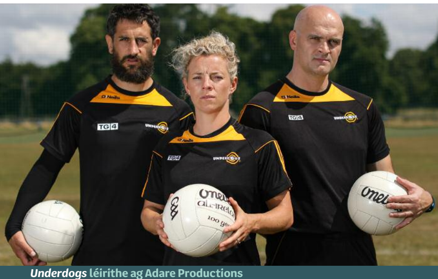
Underdogs léirithe ag Adare Productions

bliana 2018, go mór mór ó fhómhar na bliana 2018 ar aghaidh, an chéad uair a raibh ar chumas TG4 réimse suntasach den ábhar nua ó na socruithe ollsoláthair a chur sa sceideal.