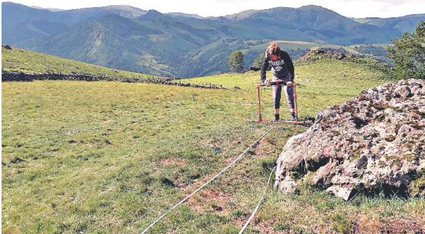
Elektrodoak erabiltzen dituzte egitura gogorren lurpean bilatzeko. P.M.