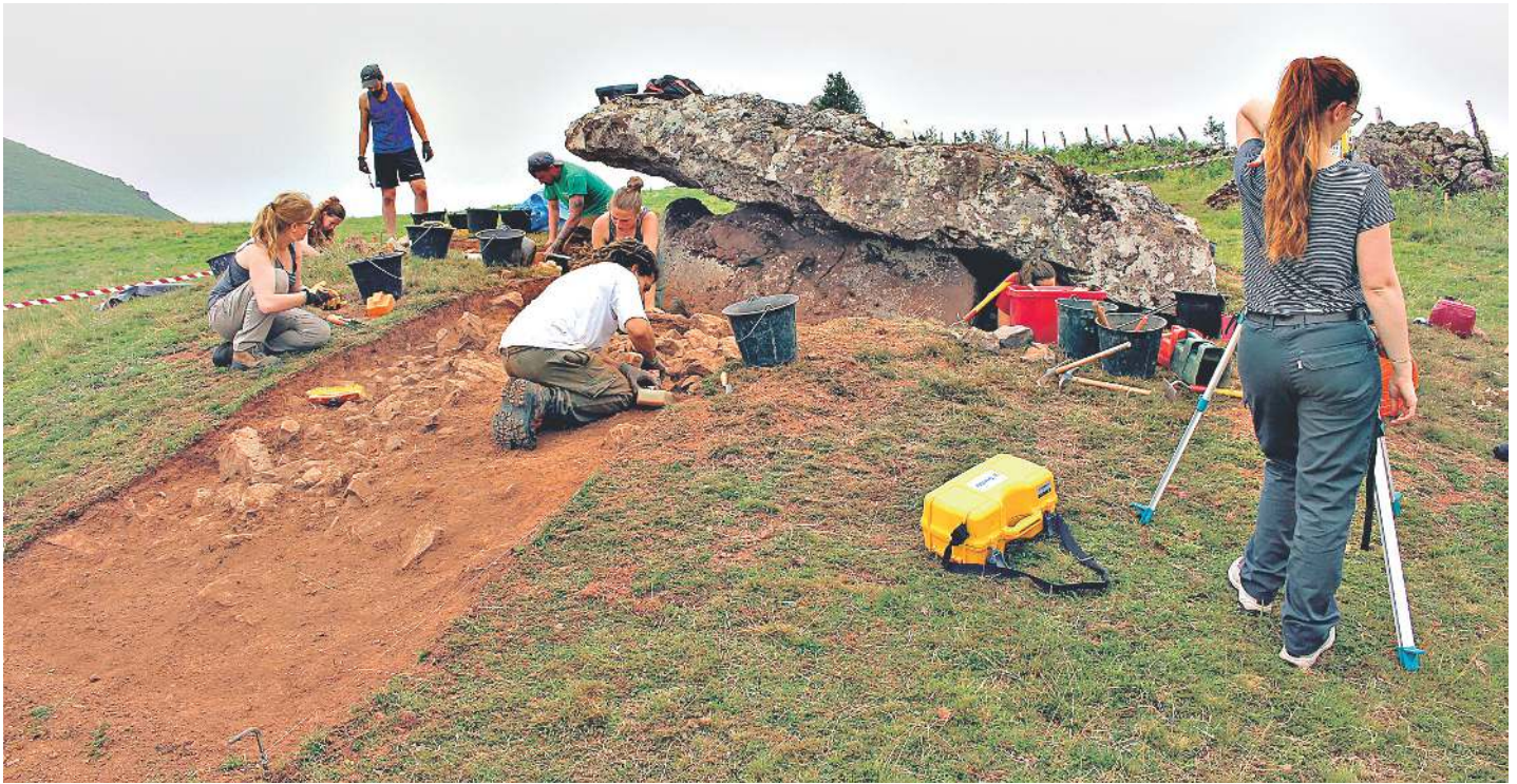
Armiagako trikuharri inguruko miaketak, duela bi urte. Irailean berriz hasiko dituzte. PABLO MARTIKORENA

Behorlegiko Armiagako trikuharriko miaketak irailean hasiko dituzte berriz Okzitaniako Tolosako Unibertsitateari lotu arkeologoek. Azken lau urteetan egin ikerketen bidez, Hergaraiko Neolitoko megalitoez doi bat gehiago badakite. Informazio taula ezarria dute, funtsean, tokian berean.