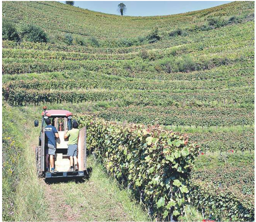
Besteak beste, mahastietako tresneriaren erabiltzen ikasiko dute ikasleek. JOANES ETXEBARRIA

Hastapenean, langile-mahastizainen formatzea da helburua,