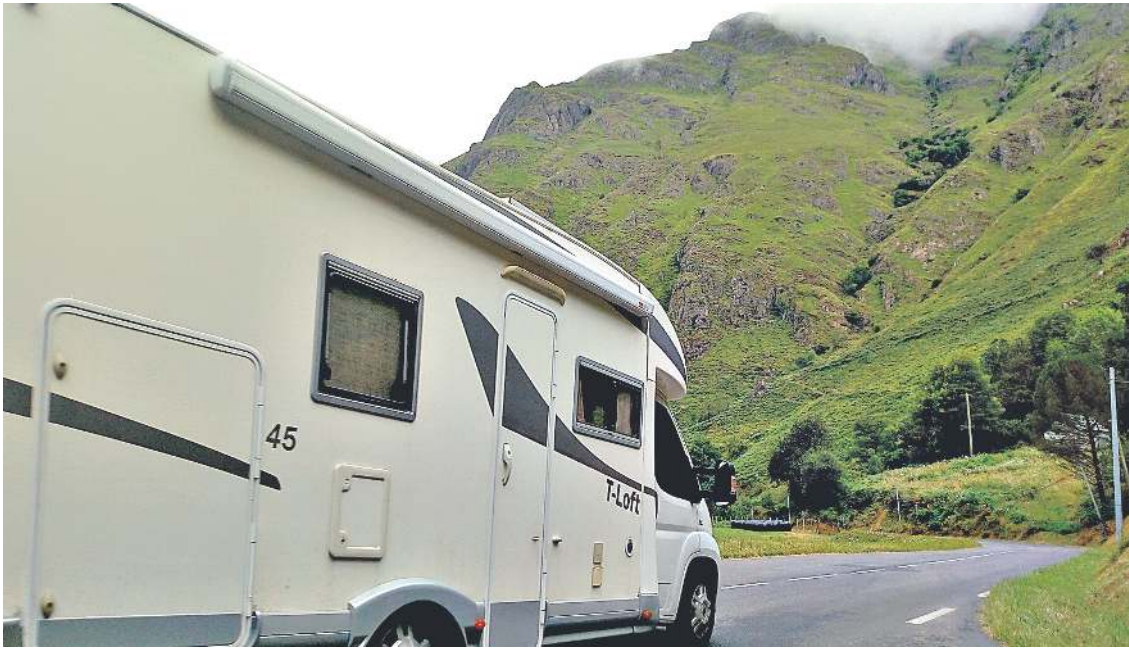
Autokarabanak mendian ibiltzea ez da berria, baina aurten arazo bilakatzen dira Iratiko soroan bereziki. J.E.

Kostaldekoko saturazioak eraginik eta konfinamenduak ere horretara bultzaturik, sasoi hastapen arras jendetsua dute mendiko eskualdeetan; onura eta kalteekin.