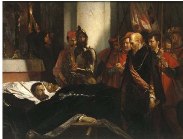
Les derniers honneurs rendus aux Comtes d'Egmont et d'Hornes (Louis Gallait, 1851) Raadhuis, Zottegem

Op woensdagochtend 5 juni 1568 werden beide vrienden om 11.00 uur naar buiten geleid en onder grote publieke belangstelling naar het schavot gebracht, op de Grote Markt van Brussel. Daar werden eerst Egmont en vervolgens Horne onthoofd. ■