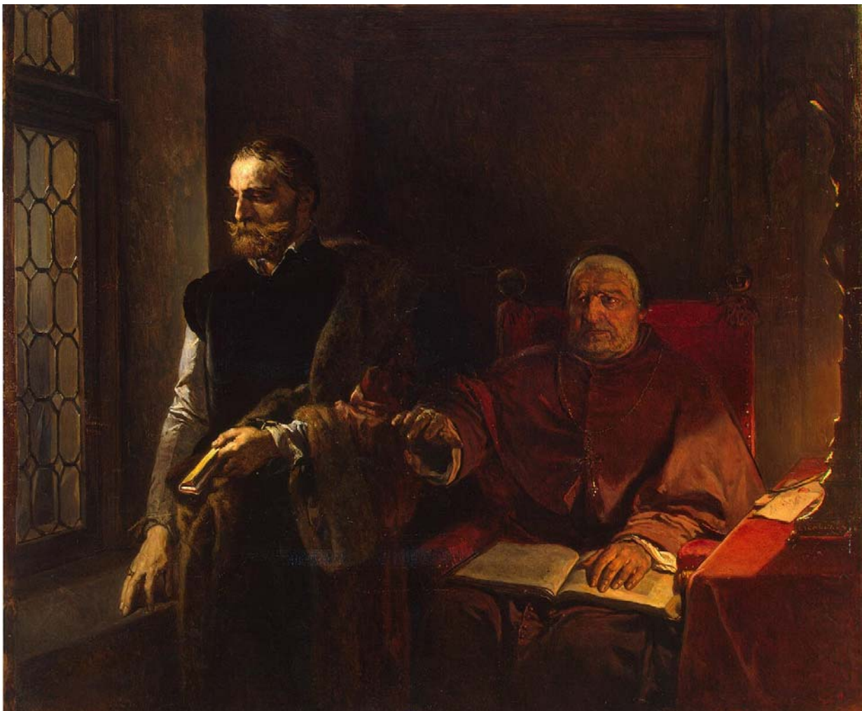
De laatste ogenblikken van de graaf van Egmont bijgestaan door de bisschop van Ieper (Louis Gallait, 1853) Collectie Koninklijke Musea voor Schone Kunsten van België, Brussel

De dood van Egmont en Horne, 450 jaar geleden, wordt vaak genoemd als beginpunt van de Tachtigjarige Oorlog. Iedereen heeft wel eens gehoord van deze jarenlange opstand tegen de Spaanse koning Filips II. Maar wat is de betekenis van die oorlog, waarom is dit conflict voor Nederland belangrijk? In de tentoonstelling 80 jaar oorlog laat het Rijksmuseum met bijzondere kunstwerken en spannende voorwerpen zien hoe geweld, opstand en burgeroorlog, terreur en onderdrukking, religieuze vervolgingen en vluchtelingen konden leiden tot het ontstaan van het huidige Nederland en België, zonder dat dit ooit de bedoeling was. ■