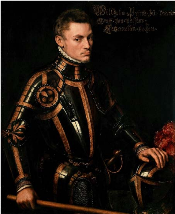
Willem, Prins van Oranje

Vervolgens stuurde het driemanschap opnieuw een protestbrief aan de koning. Egmont dreigde zelfs met opstappen uit de Raad van State als Granvelle niet zou vertrekken. Een jaar later vertrok Granvelle uiteindelijk, tot grote blijdschap van de Liga.