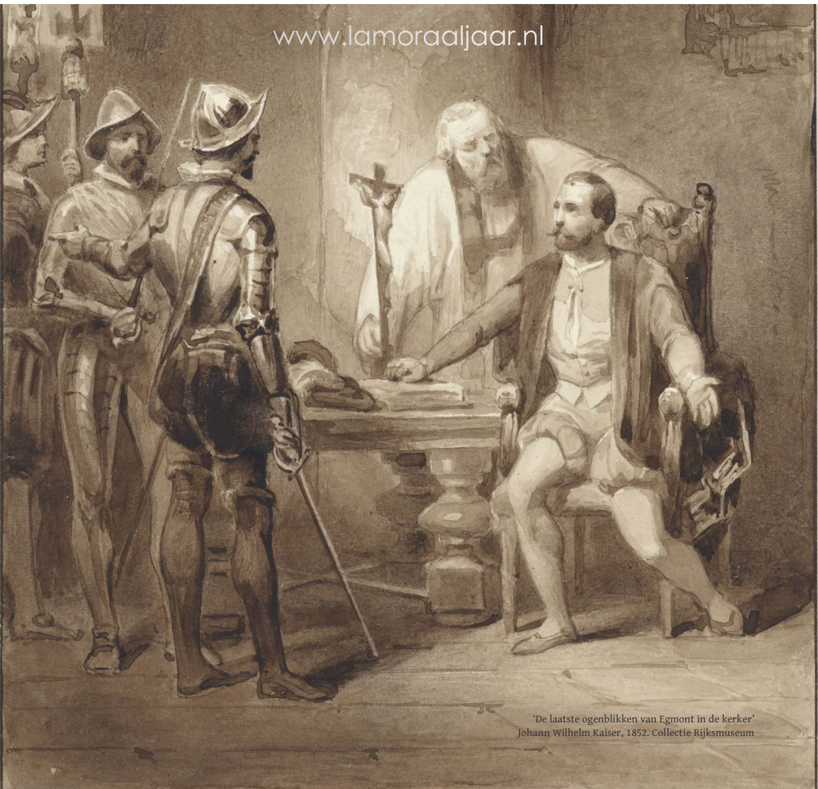
'De laatste ogenblikken van Egmont in de kerker' Johann Wilhelm Kaiser, 1852. Collectie Rijksmuseum