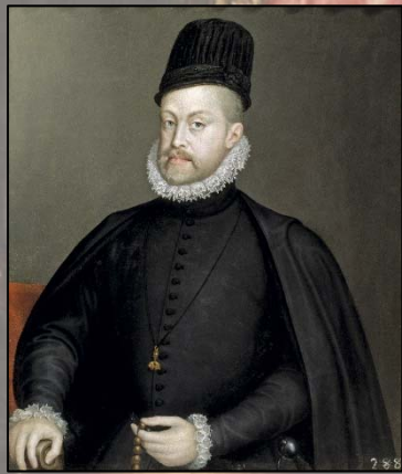
Filips II van Spanje