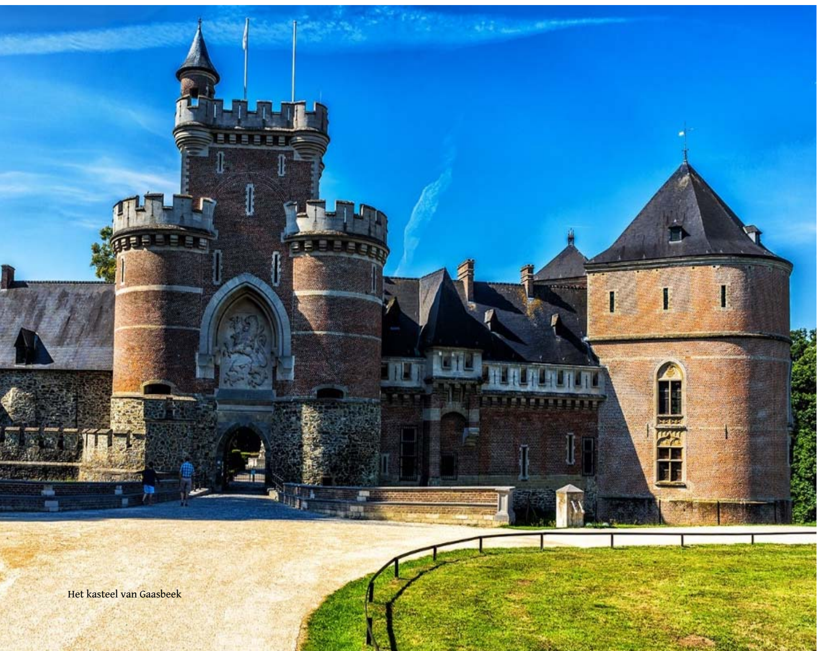
Het kasteel van Gaasbeek

GAASBEEK Het Kasteel van Gaasbeek, 35km ten zuidoosten van Zottegem, evolueerde sinds de 13 e eeuw van strategische burcht tot zomerresidentie. Het kasteel werd in 1565 gekocht door Lamoraal en zou uiteindelijk de verblijfplaats van Sabina van Beieren en haar kinderen worden, na de dood van haar man. ■