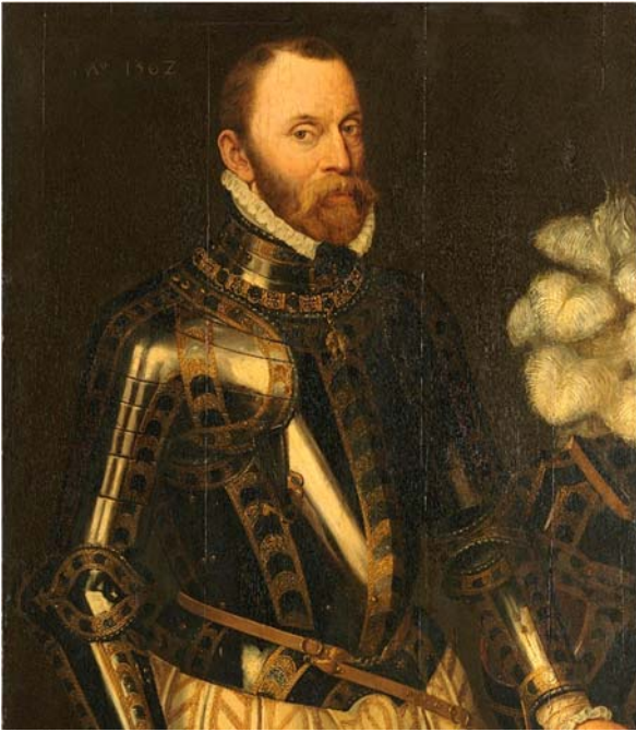
Filips van Montmorency, Graaf van Horne

Na enkele eerdere protestbrieven vroegen Oranje, Egmont en Horne op 11 maart 1563 per brief aan Filips II om het ontslag van Granvelle. Die antwoordde geen reden te zien om iets te wijzigen aan zijn bestuur.