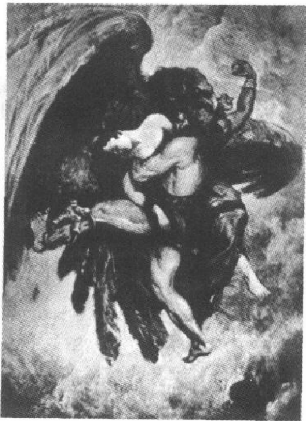
图 792 拉哇那与耶达优争夺西达之战 (印尼)巴苏基·阿卜杜拉

印尼是个先后受佛教、印度教、伊斯兰教影响的国家，在美术中亦有所反映。印尼的乡土人比太平洋所有海岛居民都更有着悠久的民间文化传统和发达的民间美术，虽然近代长年受