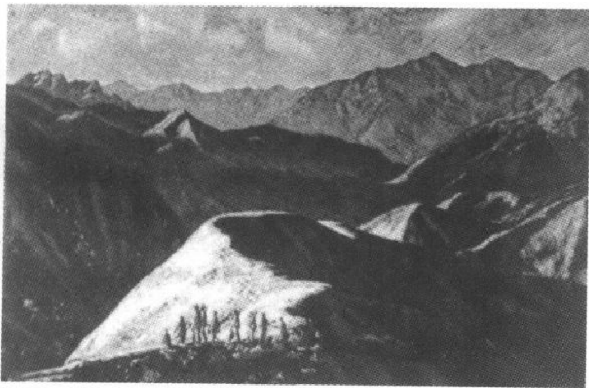
图 790 西北区的黄昏(磨漆画) (越南)潘继安

1935年至1940年间，越南的学院派美术走向成熟，油画、水彩、素描、人体、城市景观、乡间风光等，均有作品。也有一些学