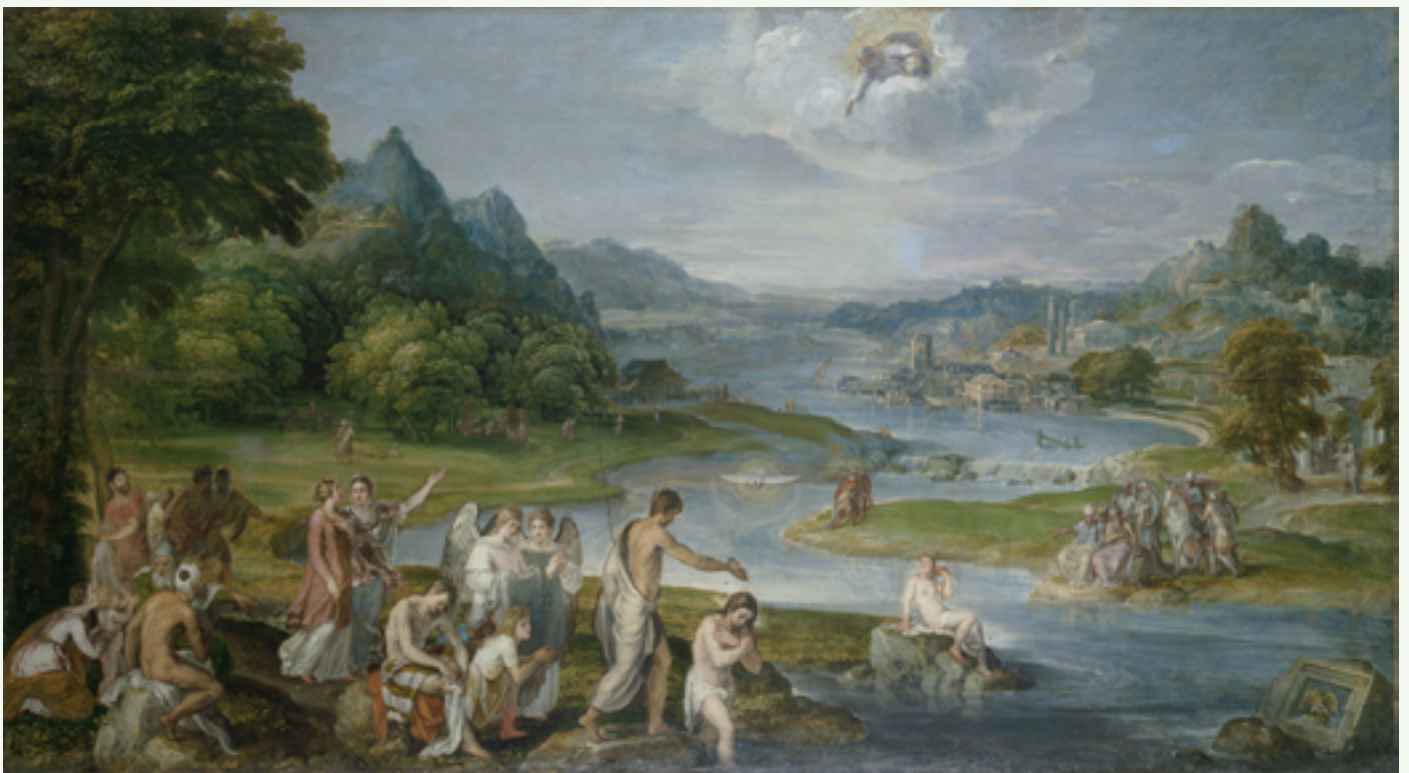
Lambert Sustris, Le Baptême du Christ , vers 1552-1553, huile sur toile, Caen, Musée des Beaux-Arts