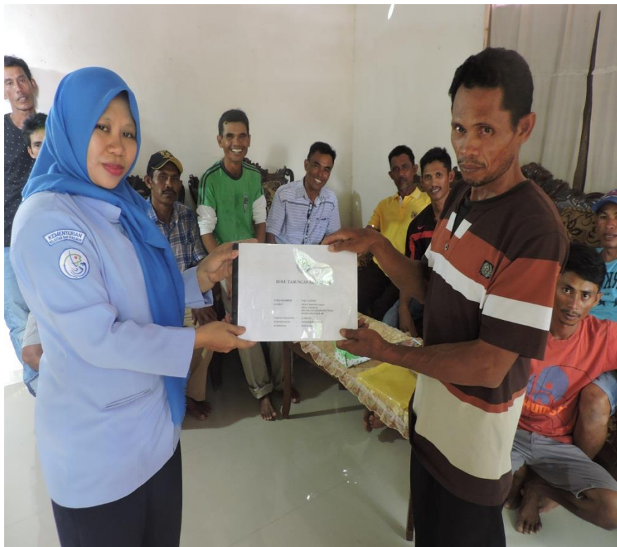
Gbr 6. Kegiatan Pendampingan Akses Informasi