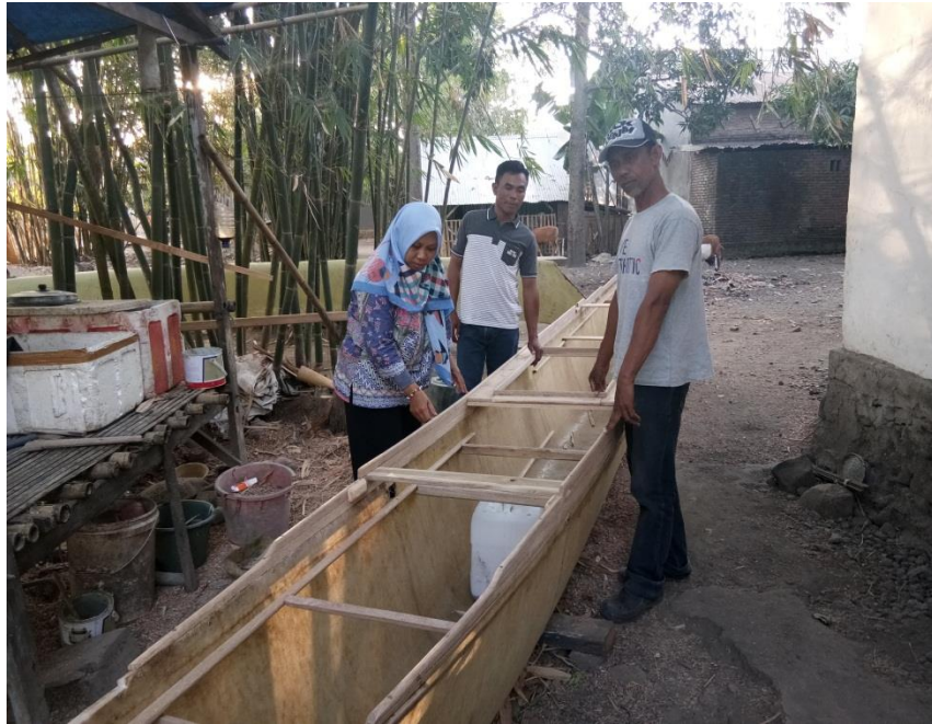
Gbr.2 Kegiatan Pendampingan Bantuan Pemerintah