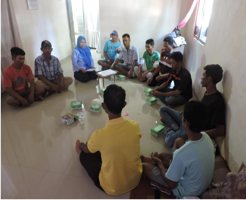
Gbr 7. Kegiatan Pendampingan Akses Permodalan