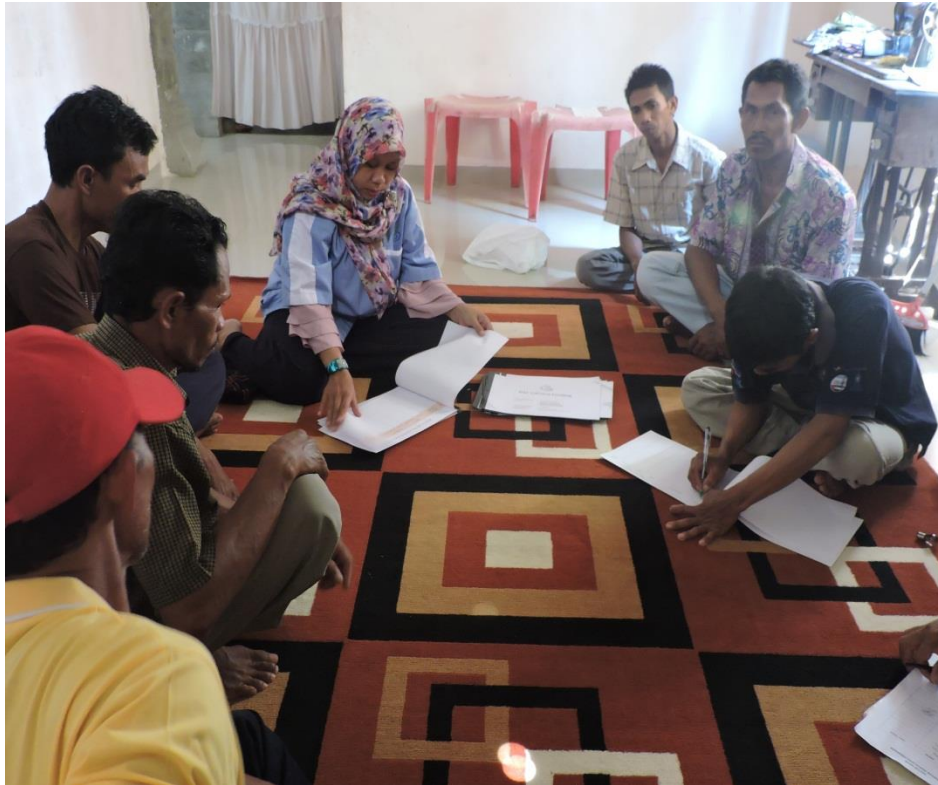
Gbr 5. Kegiatan Pendataan Kusuka