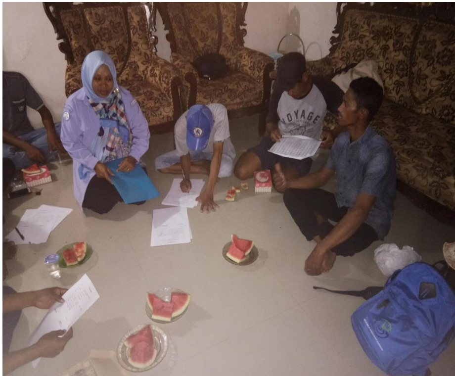
Gbr.1. Kegiatan Pendampingan akses informasi