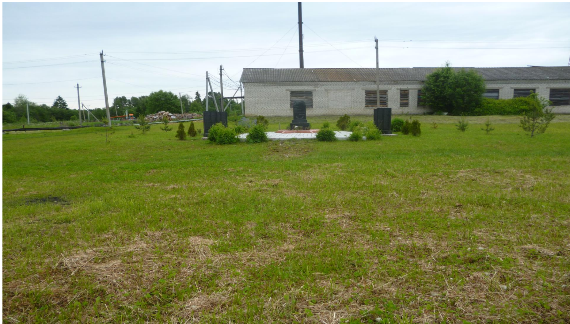
Фото территории у памятника ВОВ (настоящее время)