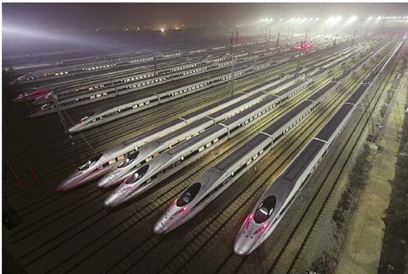
Депо скоростных поездов в Китае

ных наций на этнооснове. Во-вторых, сценарий выработки Восточной Азией во главе с Китаем новой модели капитализма для азиатского региона либо имеющей мировое значение. В-третьих, сценарий конвергенции азиатского развития по капиталистическому пути или пути хозяйственной демократии с западным капитализмом.