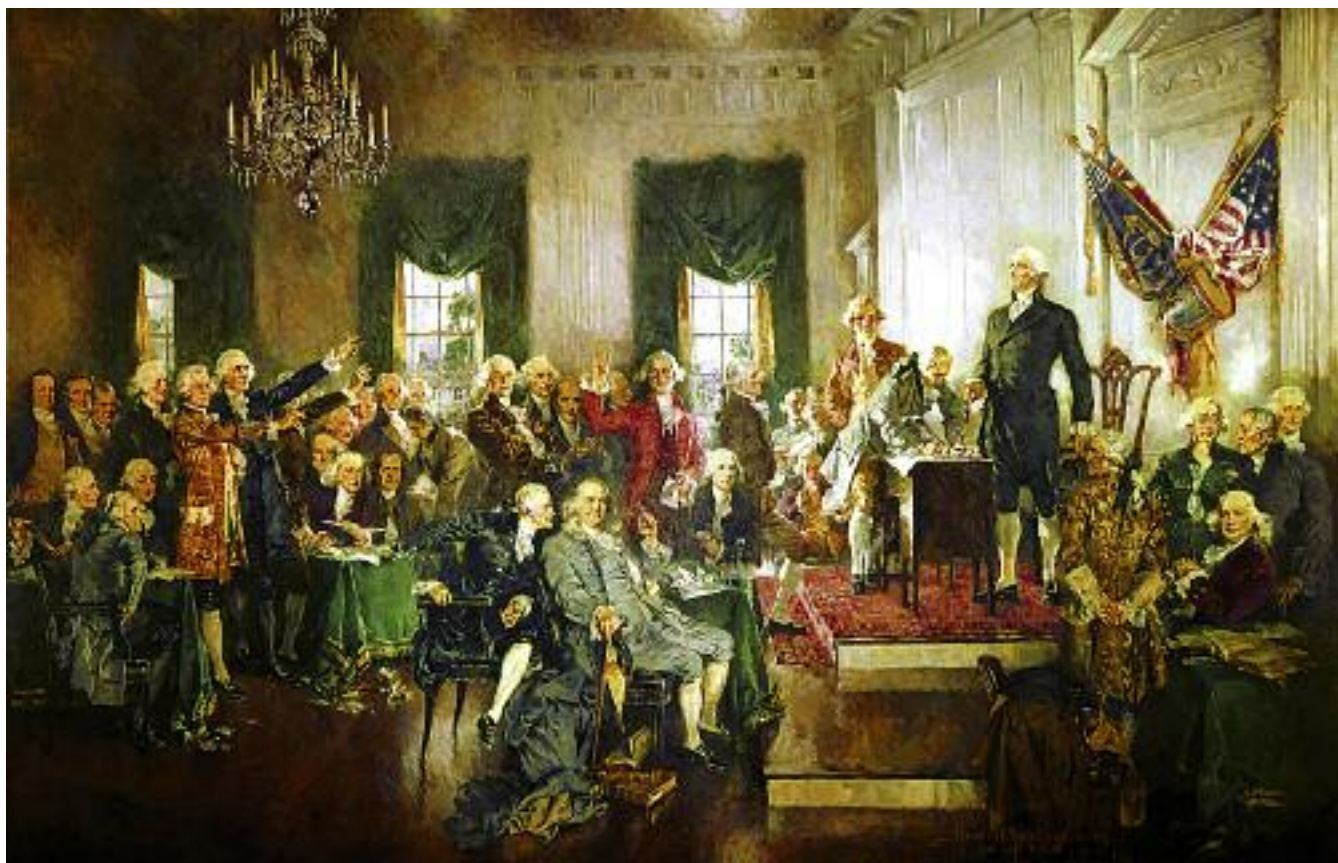
Говард Чэндлер Кристи. Подписание конституции США. 1940 год

ства, отвергается в этой формуле. Противостояние двух мировых систем, национализмы составляли препятствие космополитизму, который перед лицом этих противников не мог организовать себя.