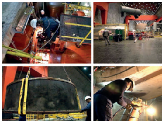
Maintenance de la centrale en 2010