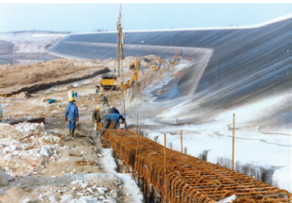
Construction de la digue de Monnès