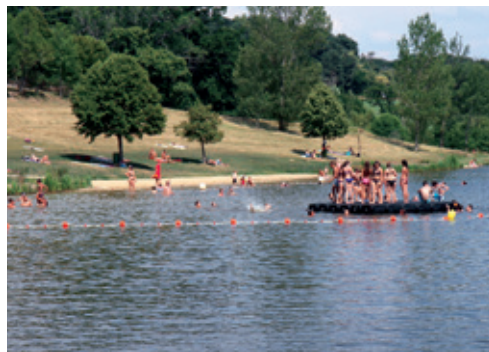
La retenue d'eau de Saint-Gervais en période estivale