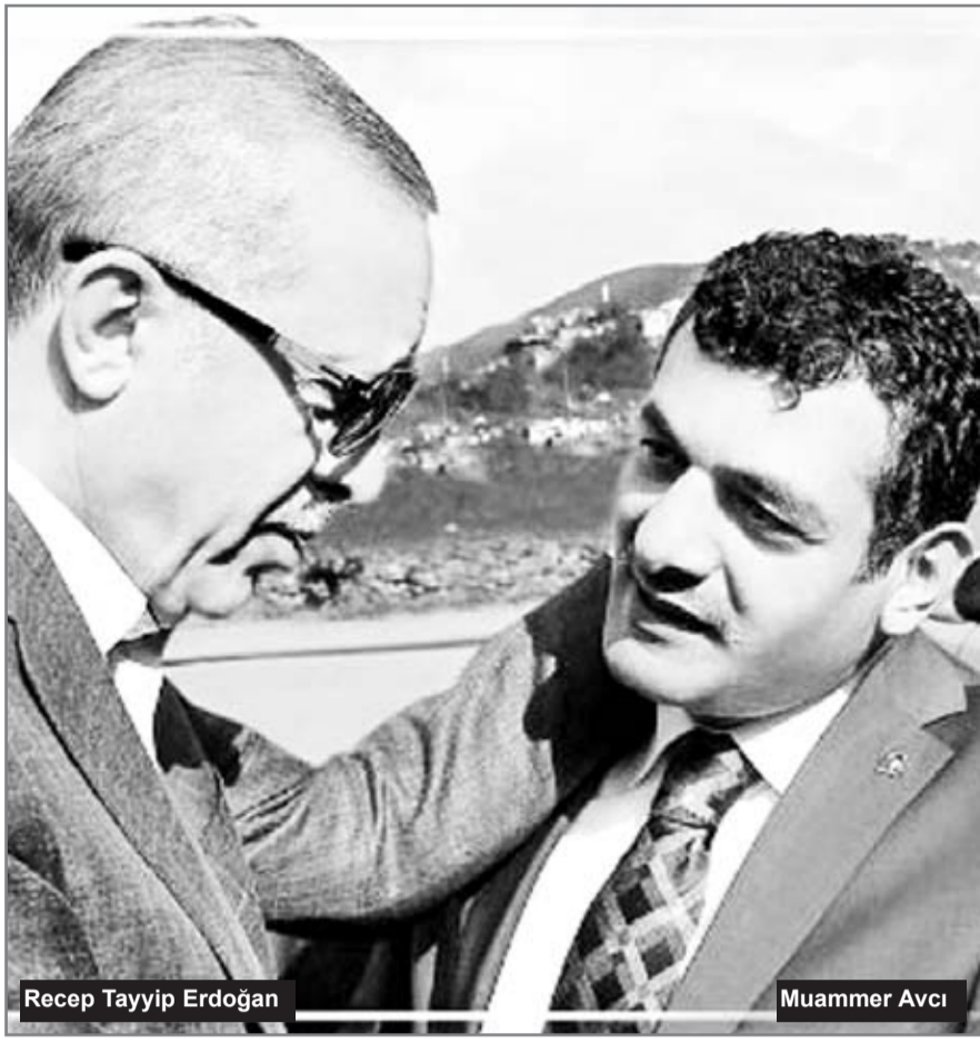
Recep Tayyip Erdoğan

10. Bu partiye yıllardır hizmet veren gençler dururken, akşamları gittiğiniz kafedeki garsonu özel hizmetinize alıp, sigortasını ve maaşını partiden ödettirmeniz etik mi? Özel hizmetinizi yapan kişinin maaşını ve sigortasını kendi şirketinizden yapmanız daha etik değil mi?