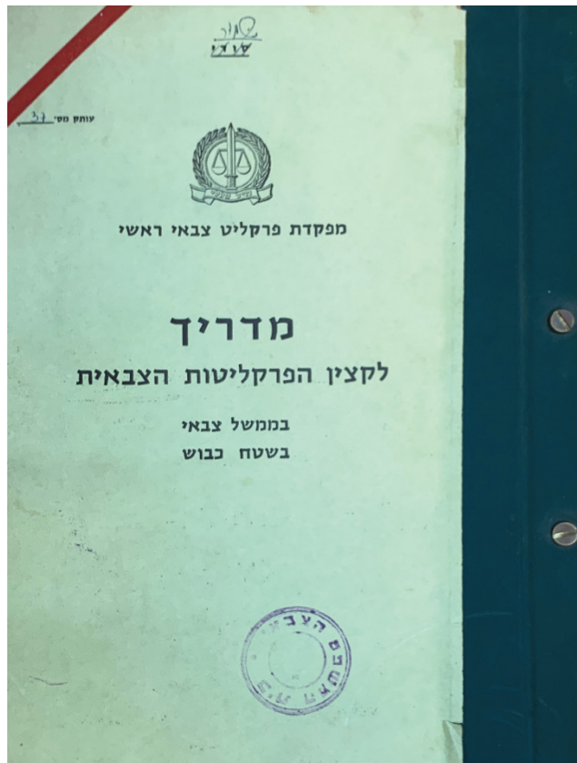
"המדריך לקצין הפרקליטות הצבאית בממשל צבאי בשטח כבוש", 1965 - כריכה.