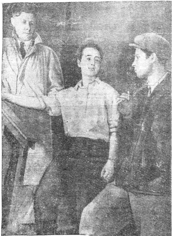
Сцена из спектакля «Два цвета».