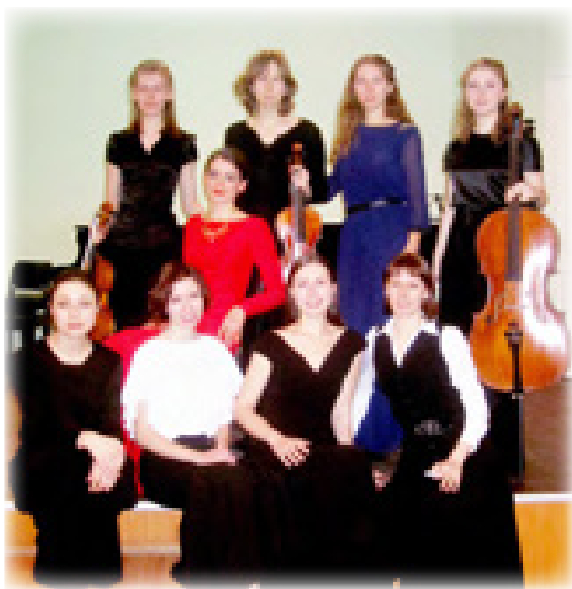
Ансамбль «Tempore Versus»

последнего такта (параллели возникают не только на уровне музыкального языка, но и на уровне текста — эпиграфа). Однако концепция вопроса оказывается сильно переосмысленной: изменяется инструментальный состав (добавляются гитара, блок-флейта), а также само расположение инструментов в пространстве; партия струнных, воплощающая «молчание друидов», передана фортепиано, изменяется динамика; общее движение идет к кульминации (множество самых разнообразных приемов игры на флейте, струнных). Неожиданно звучание обрывается, вместе с музыкой замирают и исполнители на сцене: время обездвижено.