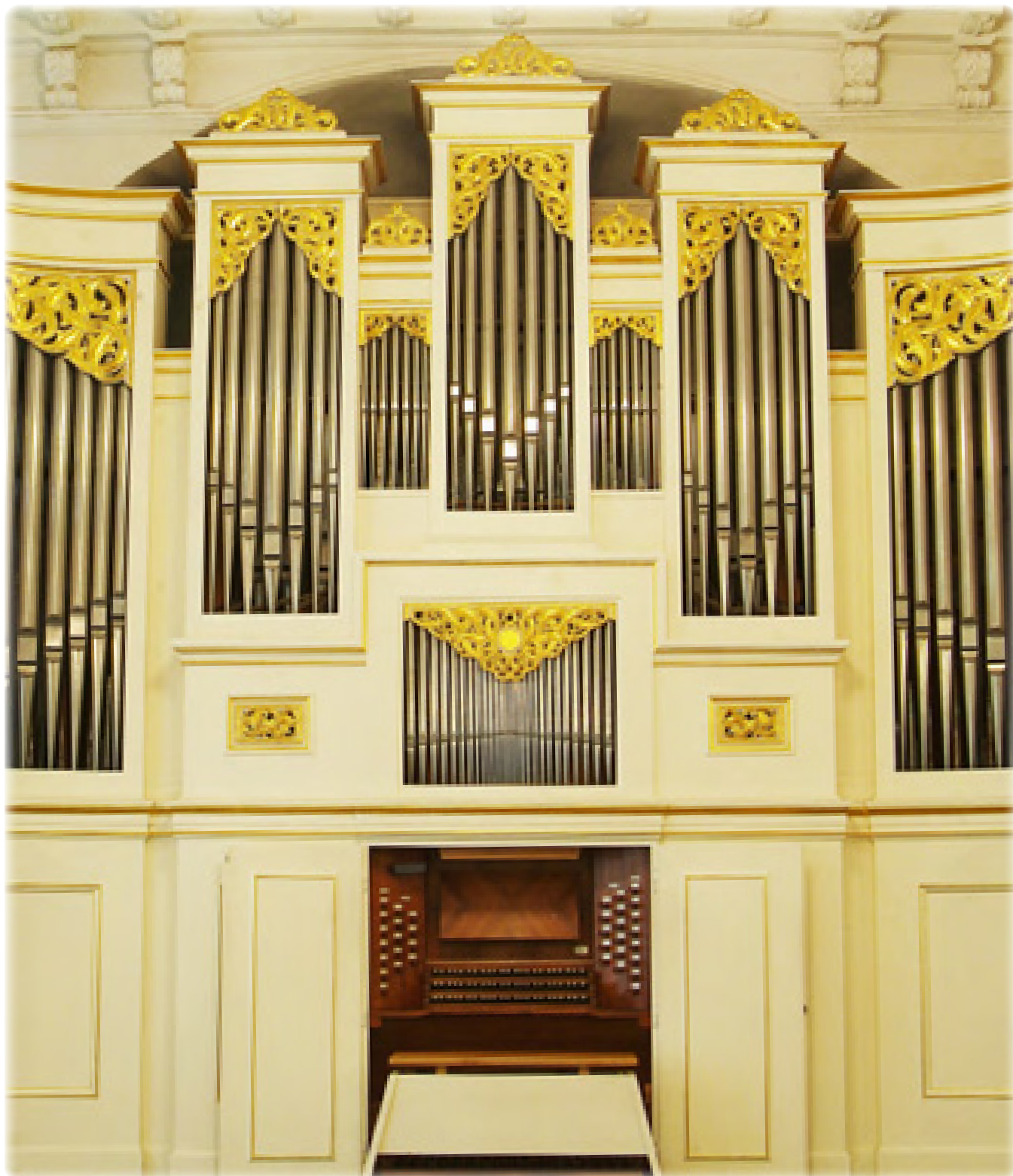
Нижегородская государственная консерватория (академия) им. М.И. Глинки