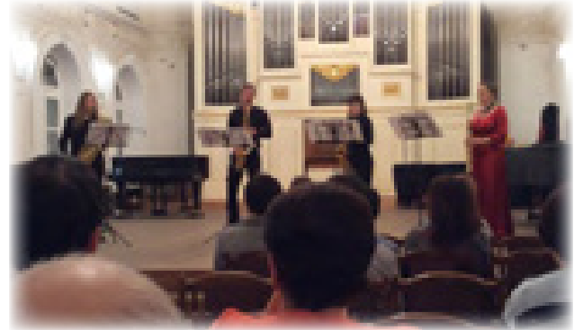
Квартет саксофонистов «Capriccio»

После возвышенно-меланхолических раздумий музыки М. Мусоргского легкая и изящная