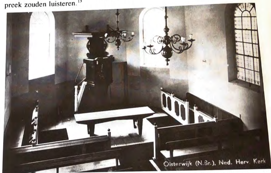
Oisterwijk (N.Br.), Ned. Herv. Kerk