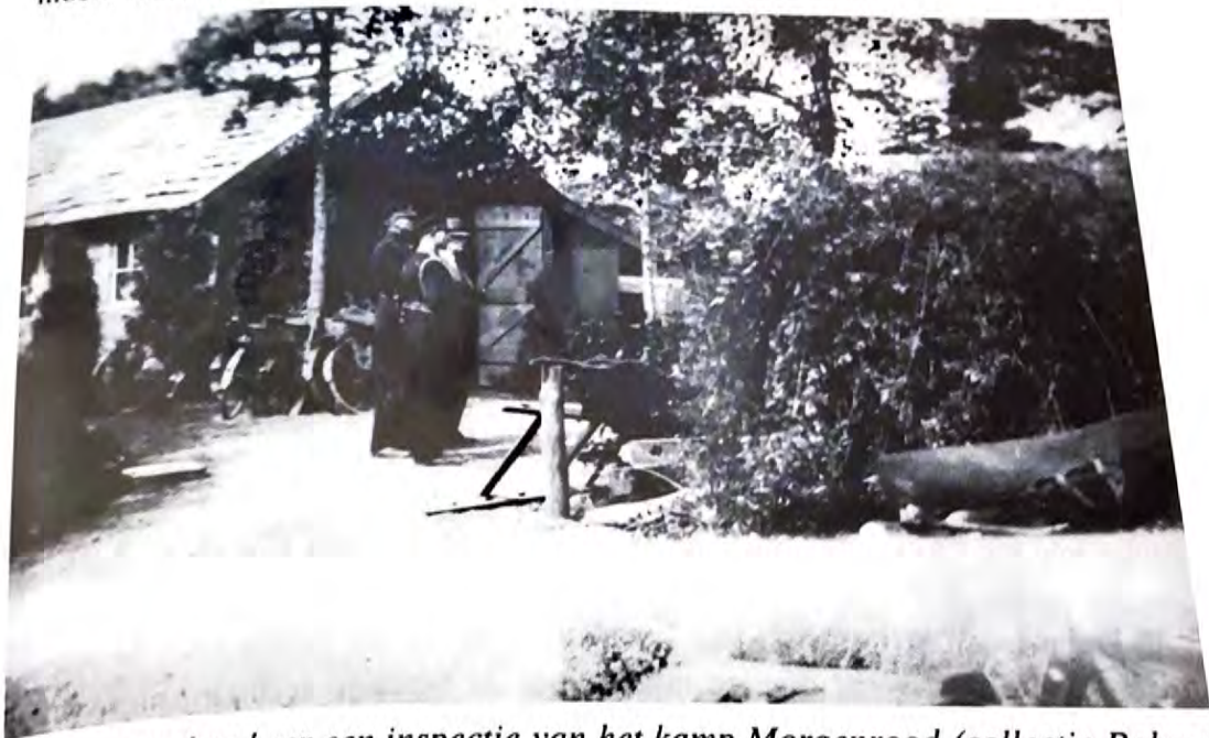
Voor de zoveelste keer een inspectie van het kamp Morgenrood.