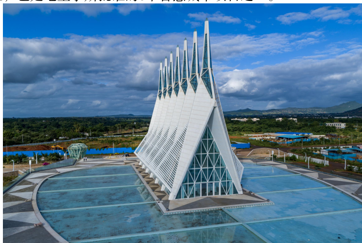
晋非经贸合作区伊甸园文化娱乐广场

【晋非合作区】毛里求斯晋非经济贸易合作区（以下简称“晋非合作区”）是商务部2006年首批命名的境外经贸合作区，距离首都路易港3.5公里，总面积211公顷，其中山西晋非自主开发73.85公顷，与毛政府合作开发137.15公顷。晋非合作区是毛里求斯首都路易港城市北拓计划的重要地区，也是毛里求斯批准的8个智慧城市项目之一。