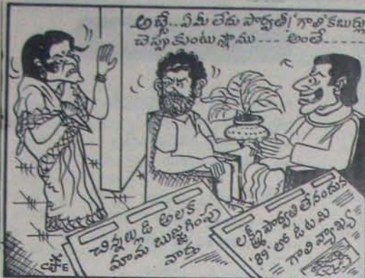
అట్టే... ఏమీ లేకుండా పోయింది... గాంధీ కలెక్షన్లు చెప్పండి... అంటే...