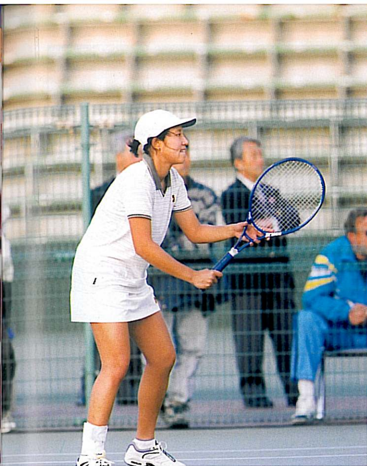
在日本舉行的 2000 年協會杯賽事 (FED CUP)。