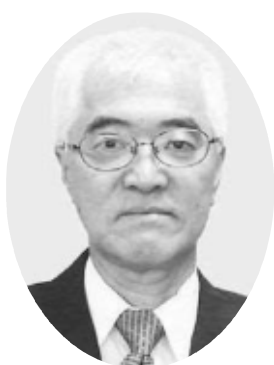
千葉委員 (職務代理者)