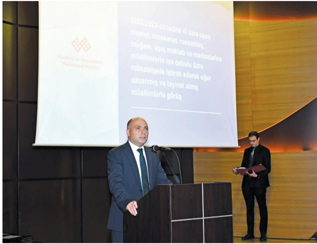
əvvəli səh. 1-də

Müəllimlərin işə qəbulu prosesi ilə bağlı məlumat verən nazir qeyd etdi ki, bu ilin 7 avqust tarixində Azərbaycan Respublikasının Dövlət İmtahan Mərkəzi ilə birgə müsabiqənin test mərhələsi, 5-9 sentyabr tarixində isə müsahibə mərhələsi keçirilib. Test mərhələsində iştirak etmək üçün qeydiyyatdan keçən 1992 namizəddən 1709 nəfər imtahanda iştirak edib, onlardan 482 nəfər tələb olunan keçid balını toplayaraq müsabiqənin müsahibə mərhələsində iştirak hüququ qazanıb. 383 nəfər elan olunmuş vakant vəzifələrə qeydiyyatdan