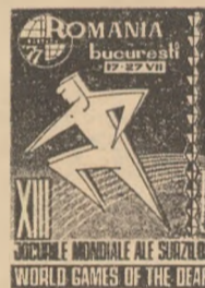
ROMANIA Bucuresti 1977