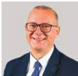
Damien MESLOT Maire de Belfort