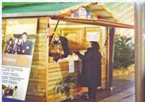
Le chalet de la solidarité

Dès 5 ans. Entrée libre. Sur réservation : 03 84 54 27 10. Bibliothèque municipale des Glacis-du-Château (avenue du Capitaine-de-la-Laurencie) à 14 h