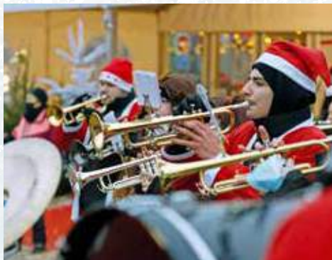
La fanfare Gugga Ratscha

Salle Kléber de l'Hôtel de Ville (place d'Armes), de 14 h 30 à 17 h 30