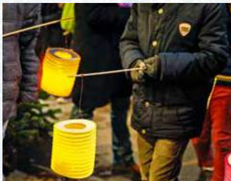
Noël aux lampions

Parvis de l'Hôtel de Ville (place d'Armes), à 17 h 15