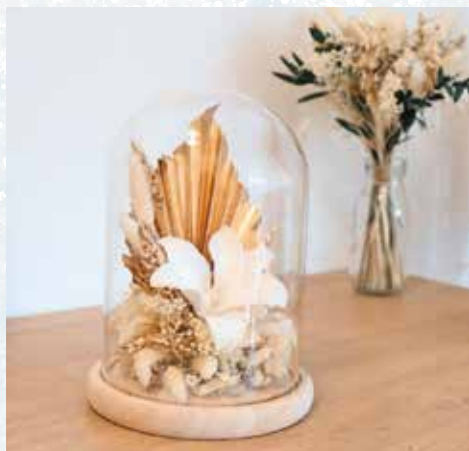
Création de fleurs séchées

Déambulation entre la place du Marché-des-Vosges, la place Georges-Corbis et la place d'Armes, de 15 h à 20 h