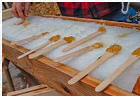
La cabane à sucre canadienne