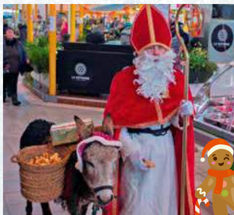
Saint Nicolas et son âne

Déambulation entre la place du Marché-des-Vosges, la place Georges-Corbis et la place d'Armes, de 15 h à 20 h