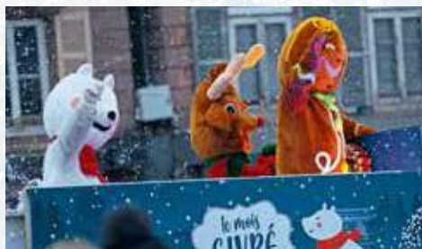
La parade de Givrou

Chalet des découvertes (place Georges-Corbis), de 14 h 30 à 17 h 30