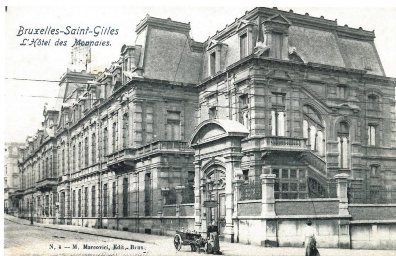
Munthof in 1885

In 1871 besliste de Belgische staat om het aan het Muntplein gevestigde atelier voor het slaan van geldstukken te verhuizen naar de gemeente Sint-Gillis en er een nieuw munthof te bouwen. Dit gebouw werd grotendeels gefinancierd door koning Leopold II en in Lodewijk XIII-stijl opgetrokken volgens de plannen van architect Armand-Louis-Adolphe Rousset (1834-1889), die later zou hebben verklaard dat « het onder het bewind van deze Franse koning was dat heel wat verbeteringen aan het muntvervaardigingssysteem werden aangebracht. » Het 5500 m 2 grote gebouw werd in 1880 ingehuldigd en genoot een vijftigtal jaar wereldfaam omdat er ook munten van verre landen uit het Midden-Oosten of Afrika werden geslagen.