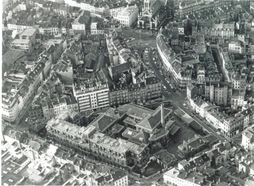
Luchtfoto, © Acronews 1957

Vlakbij het Sint-Gillisvoorplein, op het Marie Jansonplein en tussen de Munthof-, de Jourdan-, de Moskou- en de Overwinningsstraat stond vroeger het Munthof. Een eeuw lang werden in dit gebouw de munten van zo'n tweeëntwintig landen geslagen.