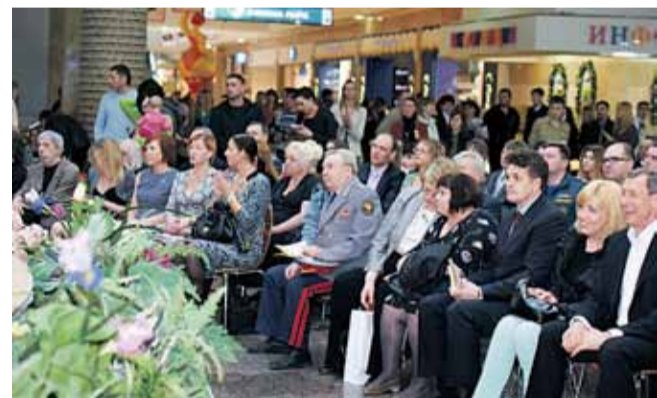
Покровская, д.43, Нижегородское отделение Союза кинематографистов РФ.

Следующий фестиваль будет проходить в октябре 2012 года. Ждем ваших заявок на участие. Присылайте свои работы по адресу: Нижний Новгород, ул.Большая