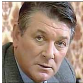
АЛЕКСАНДРУ БЕЛЯВСКОМУ к 80-летию

Вы состоялись как выдающийся художник, режиссер и сценарист. Мультипликационные фильмы, созданные Вами, стали классикой жанра, на них выросло несколько поколений юных зрителей нашей страны. Сегодня в кинематографе успешно работают Ваши ученики, которые гордятся, что их творческому становлению способствовал такой признанный мастер.