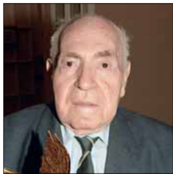
ФЕДОРУ ХИТРУКУ к 95-летию

Вы состоялись как выдающийся художник, режиссер и сценарист. Мультипликационные фильмы, созданные Вами, стали классикой жанра, на них выросло несколько поколений юных зрителей нашей страны. Сегодня в кинематографе успешно работают Ваши ученики, которые гордятся, что их творческому становлению способствовал такой признанный мастер.