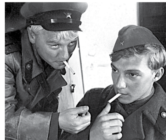
«Мне было девятнадцать»