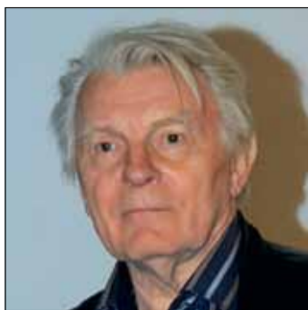
ЮРИЮ НАЗАРОВУ к 75-летию

Яркий талант и творческая индивидуальность позволили Вам стать одним из самых востребованных актеров отечественного кинематографа. Ваши роли в таких фильмах, как «Иду на грозу», «Крах инженера Гарина», «Место встречи изменить нельзя», запомнились миллионам зрителей.