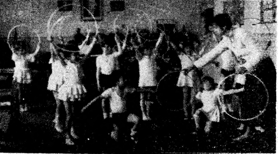
Oră de gimnastică la grădinița cu program prelungit de la Petrila.