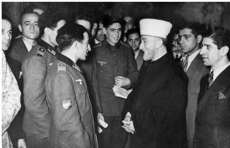
המופתי הירושלמי מוחמד אמיין אלחוסיני עם מתנדבים מוסלמים ללגיון הערבי החופשי בצבא הגרמני, ברלין 1942

אלא גם בדיכוי המרד. רבים ממחנה זה התגייסו ל'חבורות השלום' (Peace bands) וסייעו בדיכוי תומכי המחנה החוסיני. 13 אולם הפעם היה שיתוף הפעולה שונה ורחב יותר, במיוחד מפני שהאויב היה חיצוני.