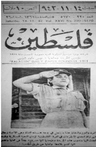
תמונתה של המתנדבת שהרזאד רחאל במדים, שפורסמה במטרה לדרבן צעירות נוספות להתגייס ('פלסטיין', 14 בנובמבר 1942)

אחריות למחסנים וטבחיות. זעזור, מרמאללה, שהייתה הקצינה הערבייה הראשונה הממונה על גיוס נשים, נשאה נאום ארוך והסבירה את חשיבות הגיוס לחברה הערבית בכלל ולנשים בפרט. לדבריה התגייסות צעירות ערביות לצבא היא מסורת עתיקת יומין, והגיע הזמן שהצעירה הערבייה תלבש את מדי הפאר והגאוה כלשונה. 83