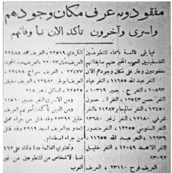
רשימת פצועים, נעדרים וחללים מבין המתנדבים הערבים הפלסטינים (פלסטין, 22 ביולי 1941)

שלא כהנהגת היישוב היהודי, למנהיגים הפלסטינים שפעלו למען ההתנדבות לא היה סדר יום לאומי ברור. למרות העידוד הבריטי הם לא דרשו להקים יחידות ערביות פלסטיניות נפרדות בדומה ליהודים. ראשי היישוב היהודי הצליחו, לאחר הפעלת מערכת לחצים