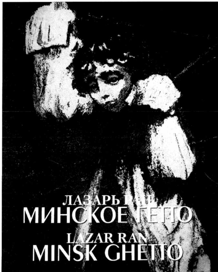
Ран Лазарь, МИНСКОЕ ГЕТТО: графика, скульптура, живопись. Альбом. Составители Инна Герасимова и Андрей Скребков. — Минск, Книгосбор, 2008. Альбом издан к 65-летию уничтожения Минского гетто.

себя технике — офорту. В конце 1943 г. в Москве на выставке «Двадцать пять лет БССР» художник впервые представляет офорт «Во время бомбардировки». С этого времени офорт становится одним из его основных видов твор-