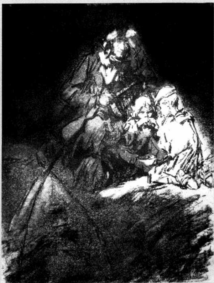
«Спасение. У партизан».