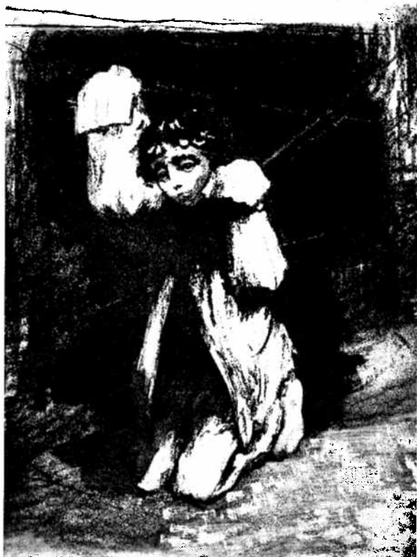
«За колючей проволокой».